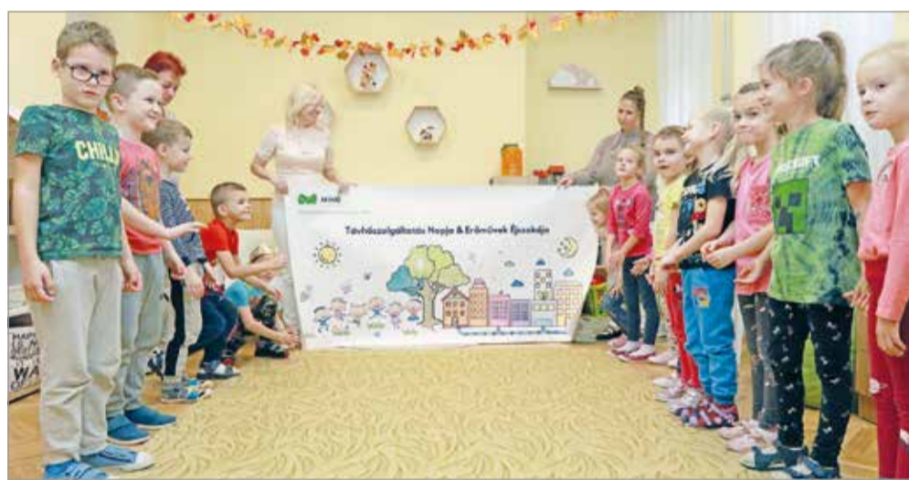
Az ovisok rendszeresen találkoznak a MIHŐ-sökkel.