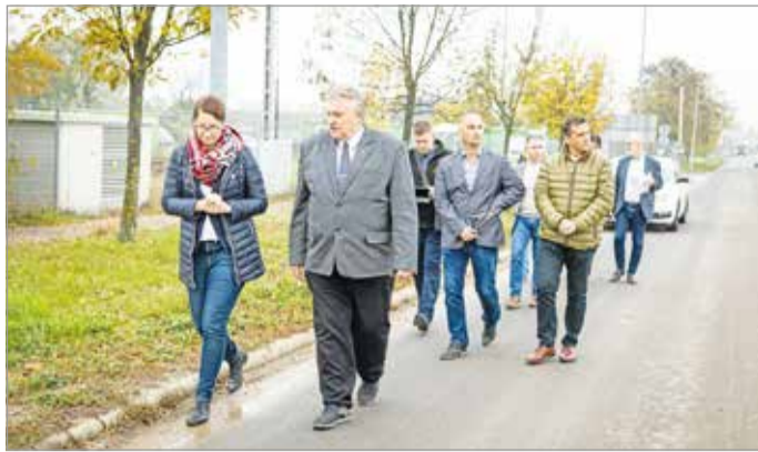
Polgármesteri bejárás a Mechatronikai Ipari Parkban.

Az infrastrukturális fejlesztés mellett több beruházás megvalósítása is zajlik. A város két éve vásárolta vissza azt a területet, ami ezelőtt évekig