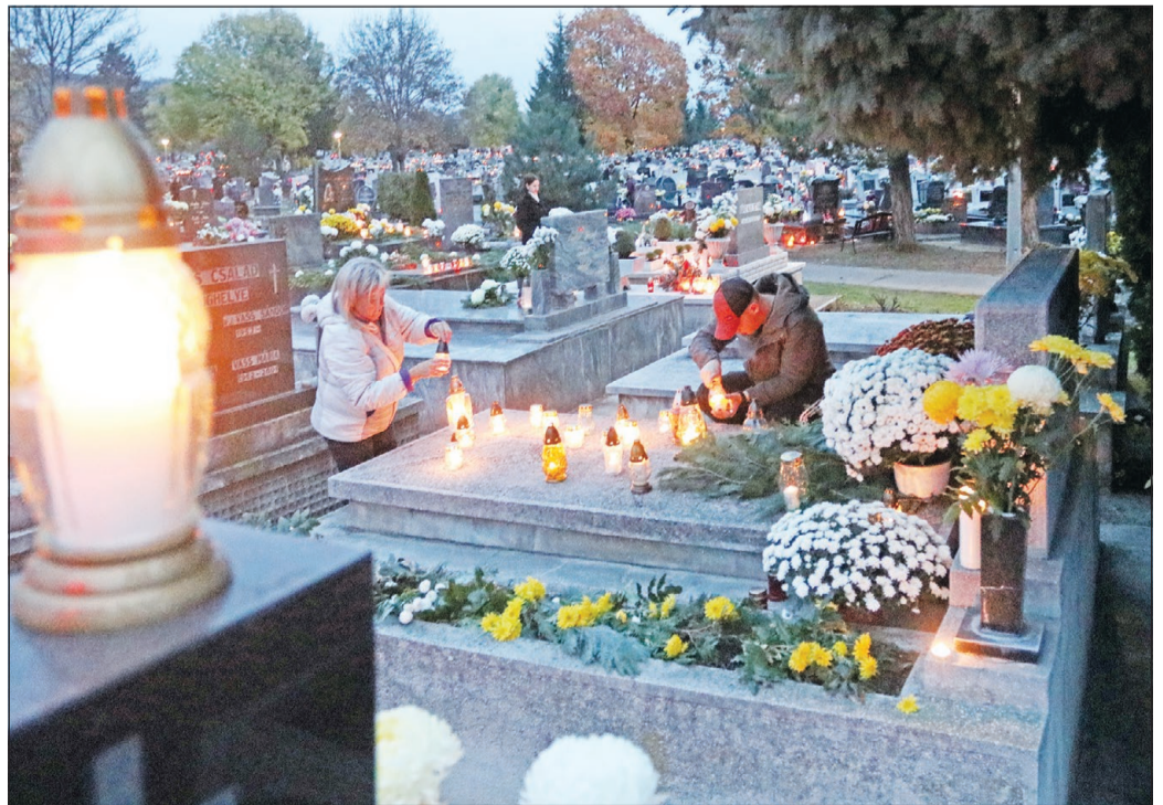
SZERETTEINKRE EMLÉKEZÜNK. „A halottak napja az imádkozás napja, azokért a szeretteinkért imádkozunk, gyújtunk gyertyát, mutatunk be szentmisét, elmélkedünk róluk, megyünk ki a sírjaikhoz, akik már elhunytak, és mi, egyházi emberek, kérjük számukra Istentől, hogy mielőbb jussanak el Isten szentháromságának közösségébe.” Cikk a 3. oldalon