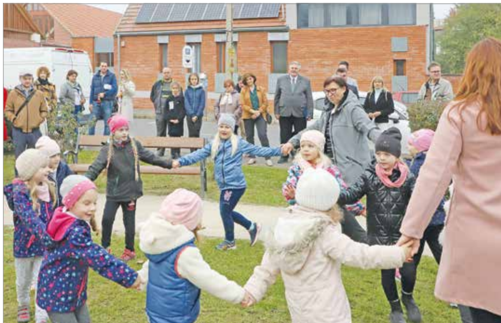
Környezettudatosságot erősítő, ismeretterjesztő „zöldtanórák” szerveződtek.

Az infrastrukturális fejlesztések az évek során szemléletformálási programokkal, közösségi virágültetéssel egé-