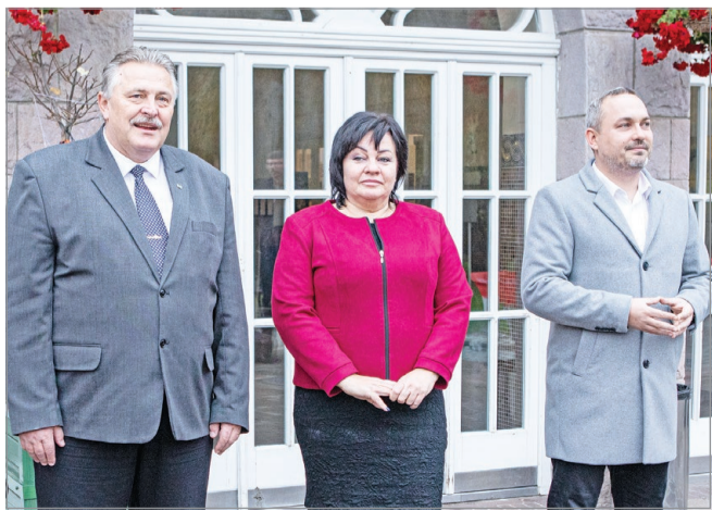
A Barlangfürdő újranyitásának pillanatai.