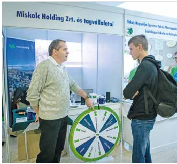
Érdeklődő a Holding pavilonnál.

Veres Pál, Miskolc polgármestere hangsúlyozta, hogy a városba egyre nagyobb számban érkező befektető magyar és nemzetközi cégek jó ott-honra lelnek, hiszen Miskolc adottságai kiválóak mind az infrastruktúra, mind a jól képzett munkaerő, mind pedig a biztos szakember-utánpótlást jelentő egyetem révén. T. Á.