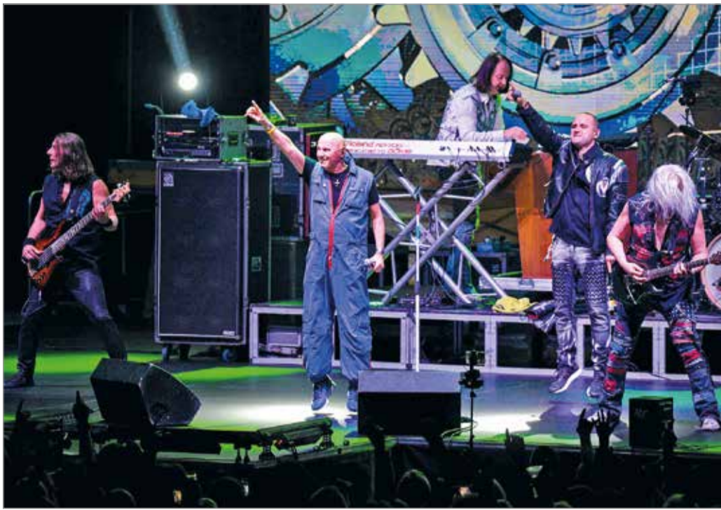
Az Edda népszerűsége töretlen.

PA: Látszik az, csak ügyesen leplezem – mondja nevetve. Azt hiszem, a rockzene konzervál, fiatalon tart, ez az egyik legfontosabb. A másik a szenvedély, a humor, amit genetikailag vagy hozunk magunkkal, vagy nem. Ez nagyon kell az élethez. A harmadik pedig a kitartás, ma már tudom mekkora érték, amit a teremtő Isten adott: énekelhetek, dalokat írhatok, és boldog-