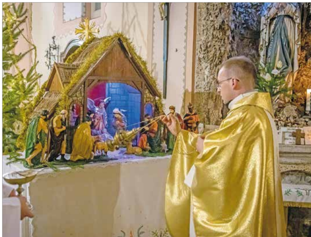
Egy korábbi éjféli mise.

„Advent a katolikus egyházi év kezdete és a karácsonyi előkészület időszaka egyszerre. Ez egy négyhetes szent idő, amely az András napját követő vasárnapon zárul. Azonban a magyar néphagyományban egy bővebb időszak és szerteágazó szokáshagyomány kapcsolódik hozzá, amit a karácsonyi ünnepkörnek nevezhetünk. Ez is advent első vasárnapján kezdődik, és vízkeresztig tart. Ebben az időben több jeles napot ismerünk, ami a néphagyományban kiemelkedően fontos volt, például maga a Szent András-nap, amikor a lányok a leendő férjüket próbálták meg tudni, és házasságra vonatkozó jóslásokat, praktikákat végeztek ilyenkor. De ez az időjárás megfigyelésére, előrejelzésére is egy fontos nap volt. Ezt követi Borbála, amelyhez – az András-naphoz hasonlóan – további férjjeszó hiedelmek kapcsolódnak. Ilyen pél-