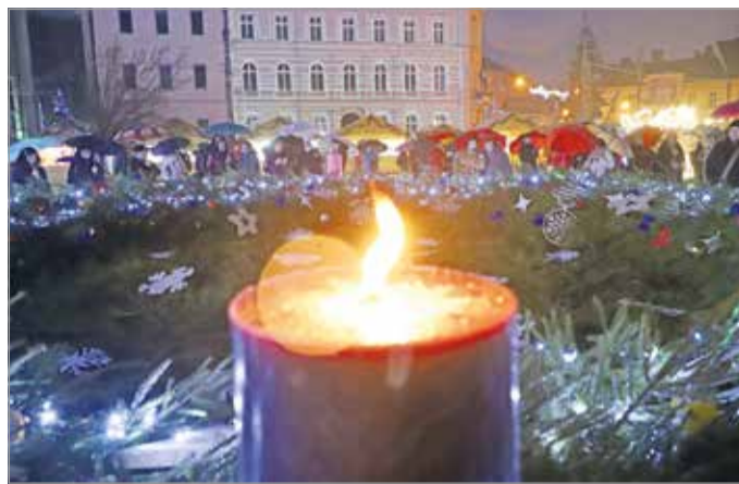
Vasárnap délután meggyújtják az első gyertyát.

A második alkalommal, december 4-én, az evangélikus felekezet szervezésében Pethő Judit lelkész hirdet igét, Varga Andrea