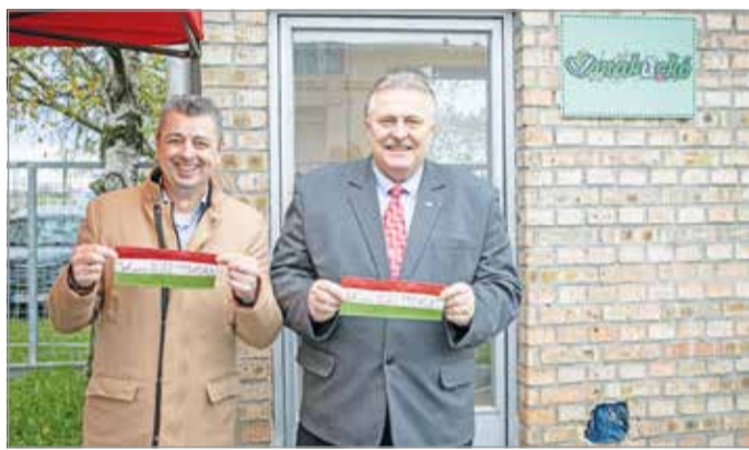
A most megnyitott MaKuckó az újrahasználati központ részévé válik.

A műhely a székhely udvarán található, ezen kívül a cég folyamatos fejlődését jelzi, hogy a korábban konferenciáknak helyt adó, harmadik emeleti termet oktatóbázissá alakították át. Itt rendszere-