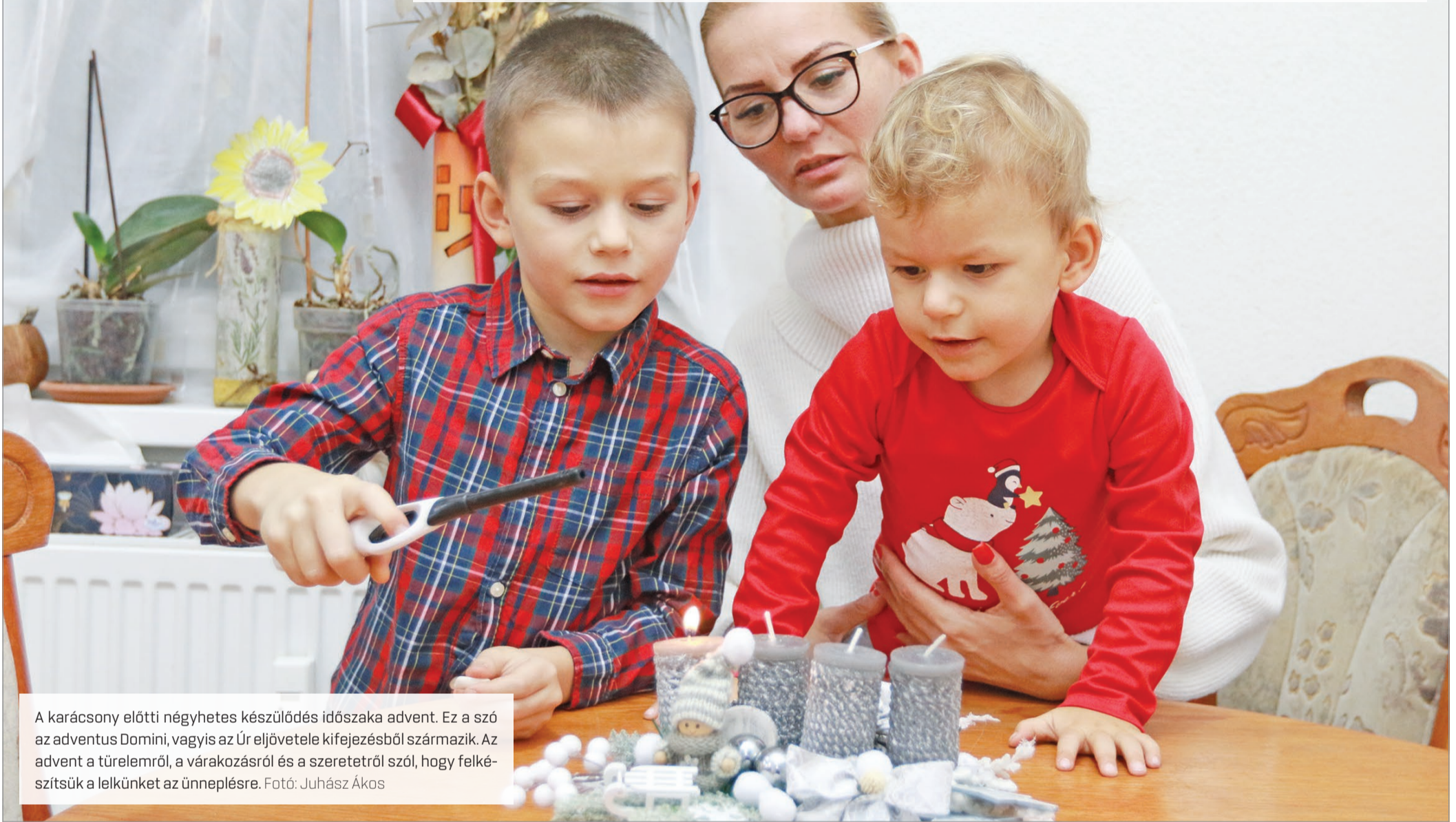
A karácsony előtti négyhetes készülődés időszaka advent. Ez a szó az adventus Domini, vagyis az Úr eljövetele kifejezésből származik. Az advent a türelemről, a várakozásról és a szeretetről szól, hogy felkészítsük a lelkünket az ünneplésre.