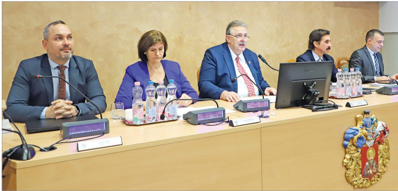
A városi közgyűlés elnöksége.