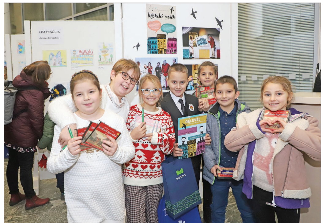
MISKOLCI MESÉK. A városháza aulájában november 21-én tartották a „Miskolci Mesék” címmel néhány hete meghirdetett rajzpályázat díjátadóját. A Miskolci Csodamalom Bábszínház felhívására megvalósult grafikai próbatétel képeit ugyanott és ugyanakkor ki is állították. A csöppségek és ifjancok papírra vetettek minden olyan emblemikus objektumot, ami megragadta fantáziájukat.