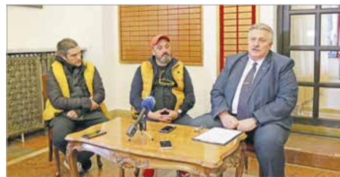
Sajtótájékoztató a színházban.