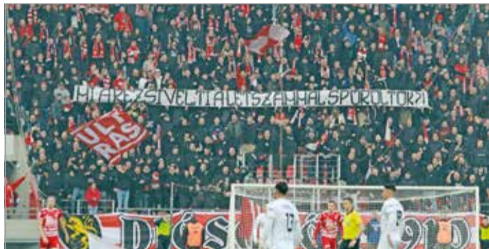
Életkép a Nyíregyháza elleni hazai derbin.

Kuznyecov Szergej vezetőedzői kinevezésével kísért a nap Diósgyőrben, az utolsó 3 bajnok jó képességű csapatokat (Szeged, Csákvár, Nyíregyháza) iskolázott le a DVTK, a szurkolóknak egy percig sem kellett izgulniuk a győzelem elmaradása miatt, a 8 szerzett gólról válaszolni sem tudtak. A Kozármisleny elleni itthoni 1-1 lóg ki a sorból, de nem lehet mindig nyerni. A Magyar Kupában hazai környezetben szenvedtek vereséget a piros-fe-