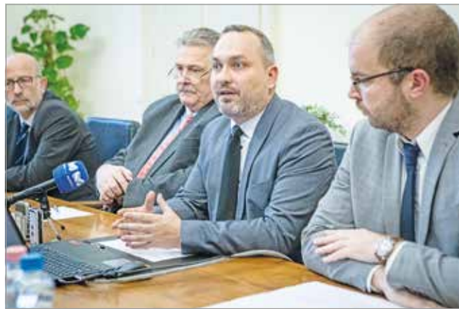
A sajtótájékoztató résztvevői.