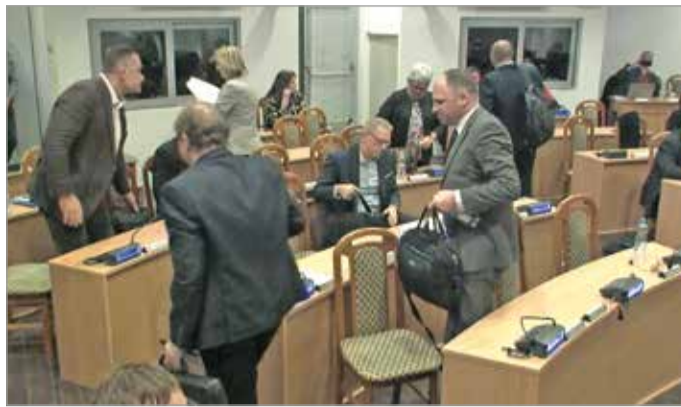
Megint csomagolnak a fideszesek, és elhagyják a közgyűlési termet.

Ezúttal azért kezdeményeztek rendkívüli közgyűlést, hogy a város csatlakozzon ahhoz a levélhez, melyet Szita Károly, a Megyei Jogú Városok Szövetségének elnöke írt Ursula von der Leyen asszonynak, az Európai Bizottság elnökének. Ezt a levelet szeptember 27-én küldték el, és a Fidesz-KDNP-nek november 14-én jutott eszébe, hogy kérje a városvezetést, csatlakozzon a levélhez. Már ez az