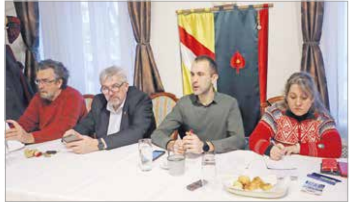
A várról tartott disputa elnöksége. Fotó: Mocsári László