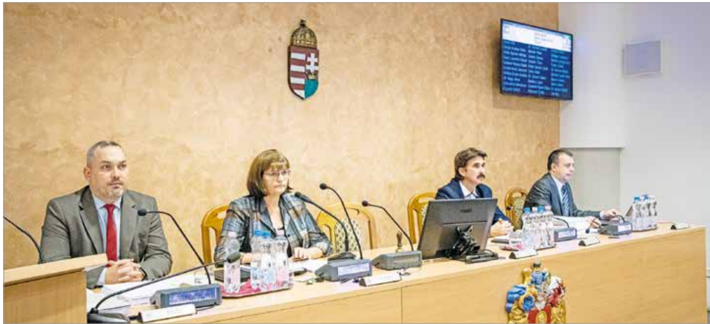
A városi közgyűlés elnöksége.

Szopkó Tibor alpolgármester hangsúlyozta: minden hangulat-keltés ellenére Miskolc működik, stabil a város gazdálkodása, sikeresen abszolválták a 2022-es évet. Ez elsősorban a „szesz gazdálkodásnak”, a városvédelmi alap létrehozásának, a reálgazdaság