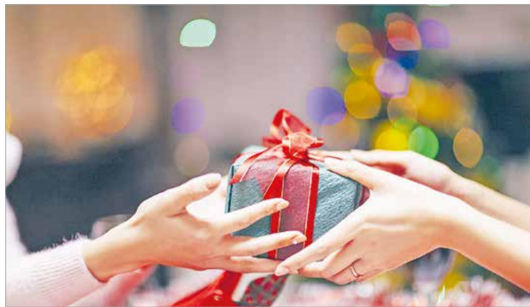
A magyarok negyedét feszültté teszi a karácsonyi ajándékozás.