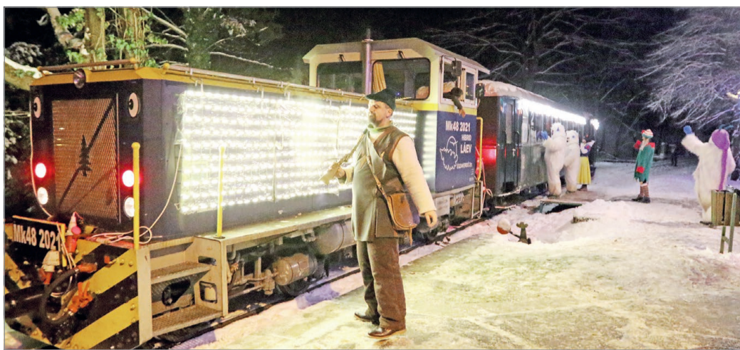
Újra zakatol szombattól a népszerű lillafüredi kisvonat.