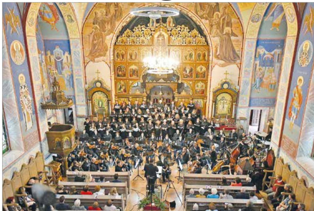
Idén újra a Búza téri templomban nyújtja át a zenekar karácsonyi ajándékát.

Igyekeznie kellett a zenerajongóknak, mert a szimfonikusok két újévi koncertje az év egyik legjobban várt miskolci kulturális programja. A jegyeket rekordgyorsasággal kaptokdták el, így már egészen biztos, hogy telt házas koncertekkel indítja 2023-at a Miskolci Szimfonikus Zenekar.