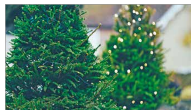
Ha fontos számunkra a környezettudatosság, mindenképp érdemes hazai termelőktől vásárolni

Az ünnep közeledtével egyre többen indulunk el a szokásos beszerző körútra, hogy hazacipeljük a legjobb vételnek ígérkező karácsonyfát. De vajon mennyit kell fizetnünk érte az idén? Melyik a magyarok kedvenc fajtája, melyik típus milyen előnyökkel és hátrányokkal bír?