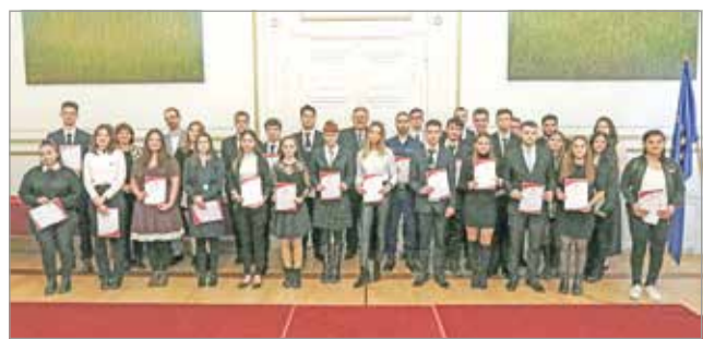
Harmincan vehettek át elismerést.