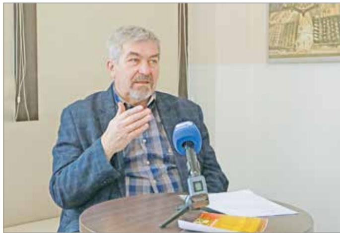
Borkuti László: a kultúra és az oktatás romokban hever.

– Az idei költségvetésben tervezett 4,4 milliárd forintos, tehetséggondozásra szánt összegből több mint félmilliárd forintot vont el a kormány. Ebből a pénzből 260 millió forintot a tankerületi központok-