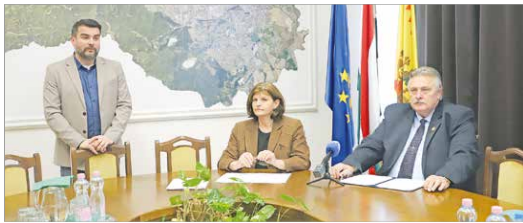
A projektek megvalósítása a következő időszakban kezdődhet el.