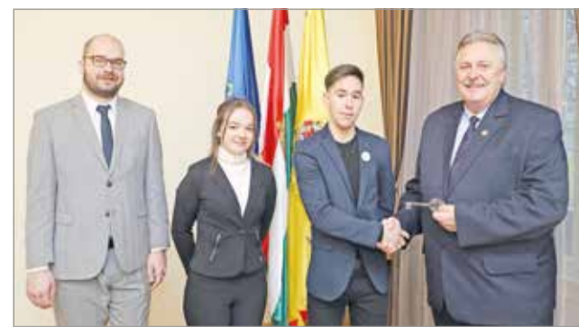
A diákpolgármestert egy alpolgármesternő is segíti.