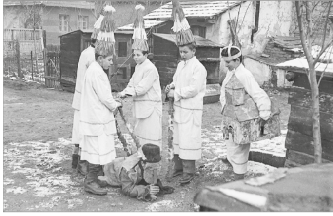
Betlehemes csoport Hejőcsabán, 1958.