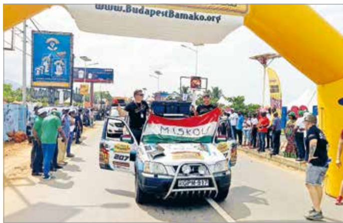
A szerencsések beérkeztek a célba is