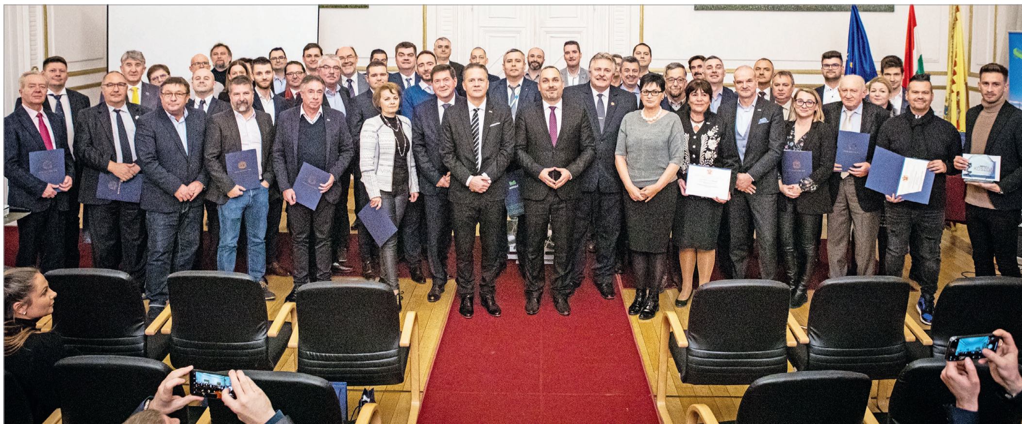
Felvételünkön a Miskolc Köszöni virilistái és díjazottjai, a szervezőbizottság, a díjátadók és a méltatók.