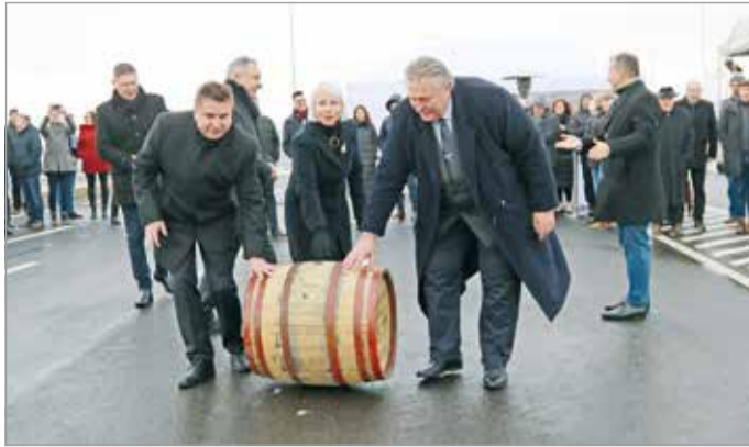
A szokásos hordógurítás.

A különféle közlekedési módok biztonságos igénybevételét lehetővé tevő fejlesztés a városképet is pozitívan meghatározó emblemikus műtárgyakkal gyarapítja a várost. A beruházás folyamatos egyeztetés mellett valósult meg, és mind a NIF, mind a kivitelező HE-DO konstruktívan állt a változásokhoz. Így épülhetett meg a Csoconai utca meghosszabbítása