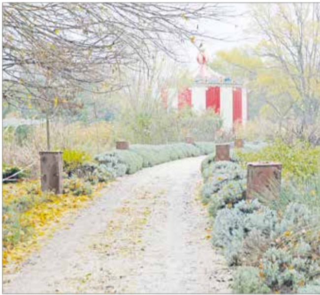
További modellezésekre van szükség.

Ismert, hogy a város vezetése 2020 elejétől több körben tárgyalt a bérlővel, amikor felmerült részéről az igény a terület megvásárlására. Ennek része volt az értékbecslés és egy vízügyi tanulmány elkészítése, hiszen fel kellett mérni, hogy a kert eladása mennyiben befolyásolja a közelben található Tavi-forrás működését,