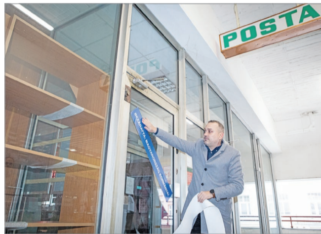
A postabezárások ellen több miskolci politikus is tiltakozott.