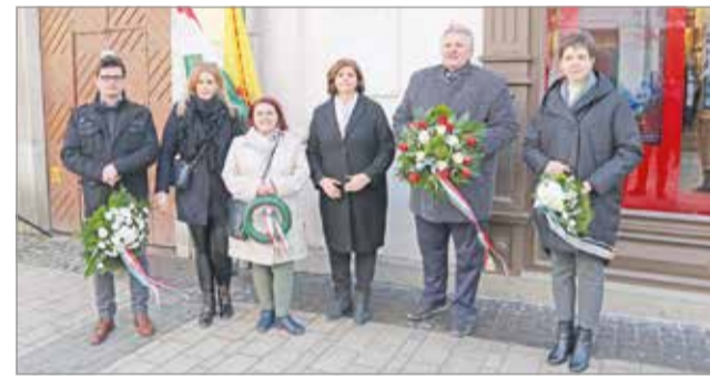
Megemlékezés és koszorúzás.