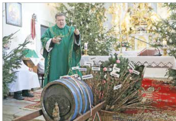
Szabó József plébános szentelte meg.

– Megtisztulva, hitben és energiában megerősödve ke-