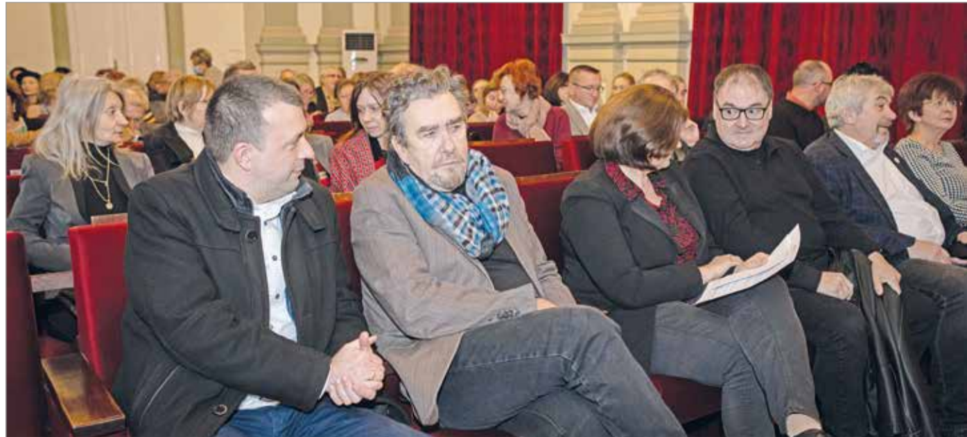
A város számára 2023 kulturális szempontból kiemelkedő év lesz.