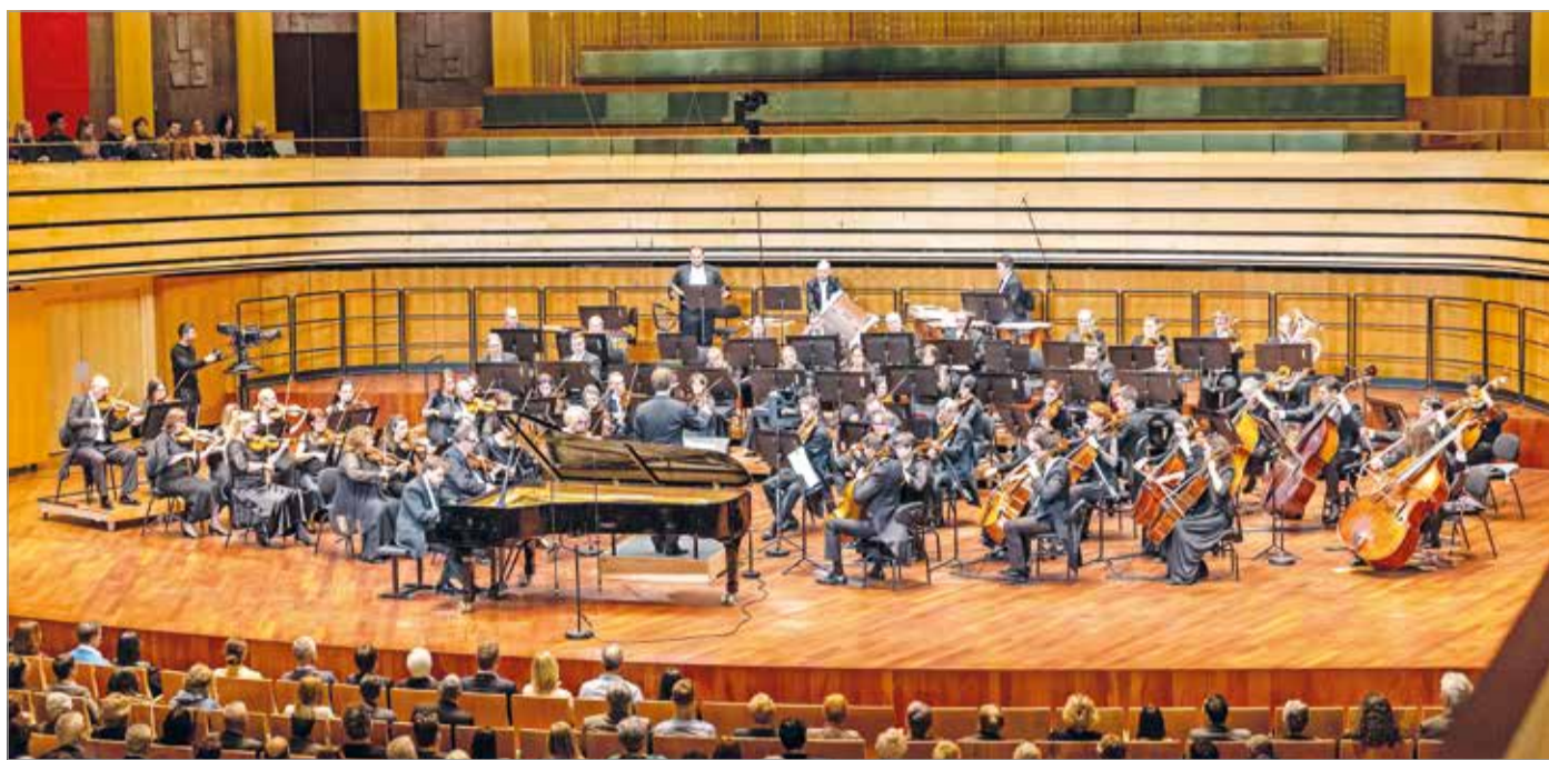
A 60 éves Miskolci Szimfonikus Zenekar múlt vasárnap adott nagy sikerű koncertet Budapesten, a Művészetek Palotájában.

19:00 Boeing, Boeing: Leszállás Párizsban , Művészetek Háza