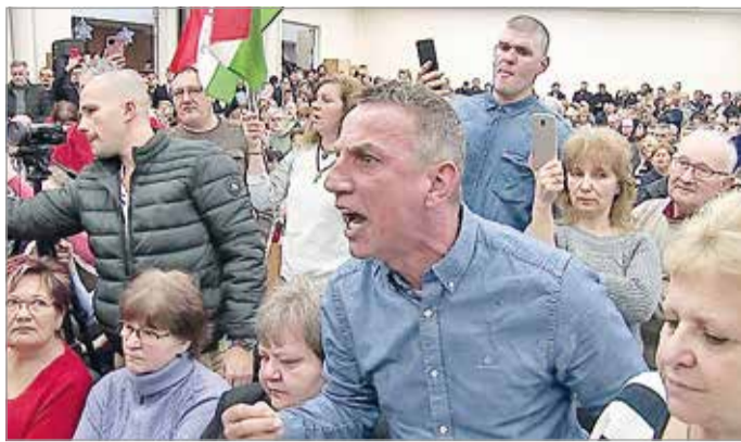
Óriási a feszültség Debrecenben.

Tavaly az ország tizenhét településén jelentek meg – a zömében ázsiai – akkumulátor-