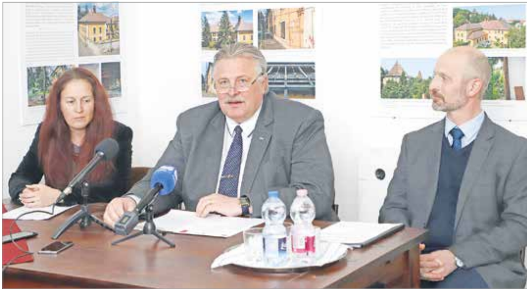
Akik a sajtótájékoztatót tartották.

A középiskola kiköltözése után pedig a város egyetlen könyvtára üzemelt itt. Komolyabb felújításon utoljára az 1970-es években esett át, azt követően, hogy 1967-ben az