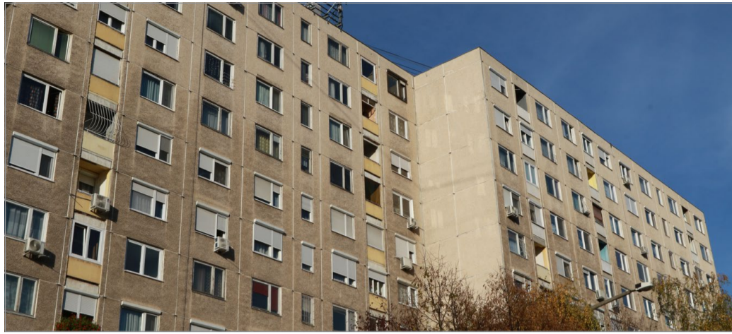
Az árak rendkívül eltérőek, de nem az avasiak javára.

A bérlők jelentős része, közel egy évtizede, nagyon kedvező bérleti díjat fizetett. Időközben azonban jelentősen nőttek a lakások fenntartásának, kar-