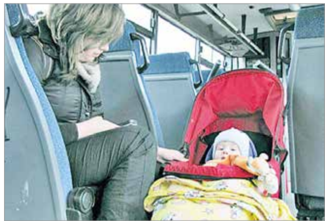
Fontos, hogy sokat legyenek szabad levegőn

Szerkesztőségünk +1 tippje: indulás előtt ellenőrizze a pmmonitoring.hu-t!