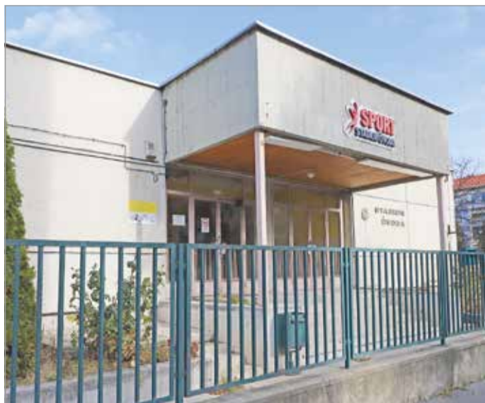
Sok esetben lassú az ügyintézés az állami szerveknél.

A Stadion Sport Tagóvoda energetikai felújításához azzal a céllal látták hozzá még 2021 őszén, hogy az épületben tartózkodók hő- és komfortérzetét javítsák, valamint, hogy az energiafelhasználás csökkentésével az üzemeltetési-fenntartási költségek is lejjebb menjenek. Ennek mentén az összes belső nyílászárót kicserélték, de – a teljes gépészeti rendszer mellett – az épület padlóburkolatait és falfelületeit is felújították. Továbbá új, zárt rendszerű, kétcsöves fűtési rendszerre cserélték a jelenlegit. Az épület fűtésszabályozását vezetéknélküli kommunikációval működő okos-radiátorszelepekkel