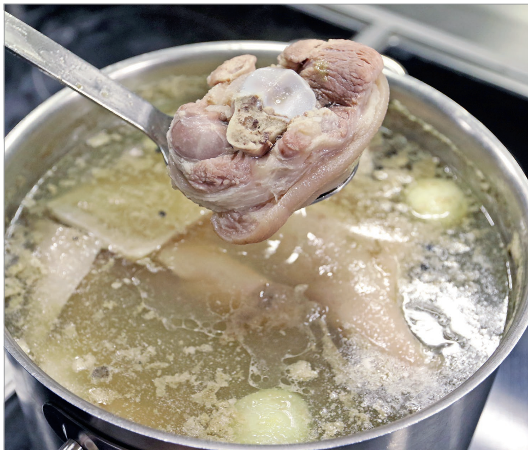
A kocsonyafőzést sohasem lehet megenni.

Így volt ez 2014-ben is: mindenki készült a már megszokottá vált programokra, ám az akkori városvezetés nem adott területfoglalási engedélyt a szervezőknek, helyette megrendezték a Becherovka Miskolci