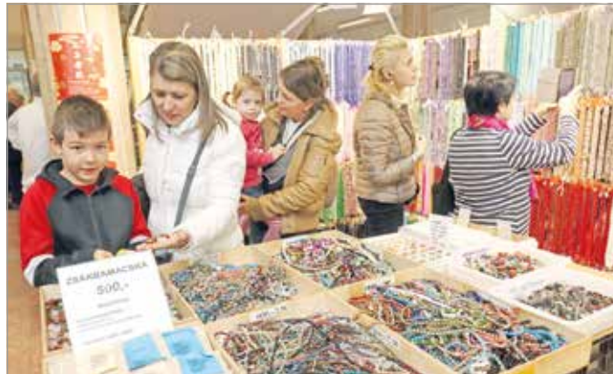
Közép-Európa egyik legjelentősebb ásványfesztiváljának évről évre a város felsőoktatási intézménye ad otthont.

A kezdetektől az a cél vezérli a szervezőket, hogy mindenki, aki valamilyen módon kötődik az ásványokhoz – érdeklődő, gyűjtő, szakember – találjon ki-