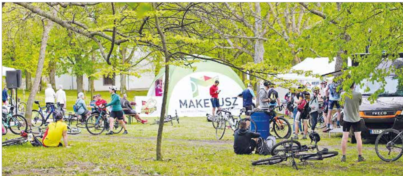
Hazánkban is egyre vonzóbb a kerékpáros turizmus.

A Magyar Kerékpáros Turisztikai Szövetség (MAKETUSZ) bővíteni kívánja a hálózatát olyan turisztikai szolgáltatókkal, amelyek kerékpárosbarát szemlélettel rendelkeznek, és ennek a dinamikus bővülő célcsoportnak az igényeit is kiszolgálják. A szövetség felhívása nyomán már több miskolci szolgáltató is csatlakozott a hálózathoz.