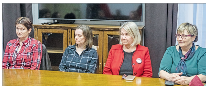
A program résztvevői.

Felső-Majláthtól kezdve a Kilián-délen és az Avason át egészen Tapolcáig, összesen tizenkét közterületet fogadtak örökbe miskolci vállalkozók és helyi civilek. Elkötelezettségükért és önkéntes munkájukért a következők mondtak köszönetet az alpolgármesteri tárgyalóban: Ta-