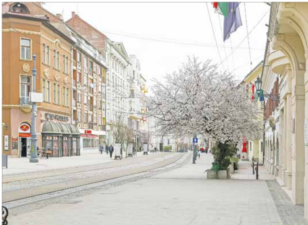
Járványos időszakban természetes jelenség, hogy elnéptelenedik az utca

A tavalyi népszámlálás előzetes adatai szerint Magyarország lakossága 9 millió 604 ezer fő volt 2022 októberében. A Központi Statisztikai Hivatal (KSH) adatai azt mutatják, hogy az ország jelenlegi területén 1980-ban éltek a legtöbben: 10 millió 709 ezren. A lélekszám azóta folyamatosan csökken. Ezt főként a természetes fogyásal magyarázzák: az idősödő korösszetétel miatt az előző népszámlálás óta 464 ezer fővel többen haltak meg, mint ahányan születtek. A hivatal szerint ezt a csökkenést a 131