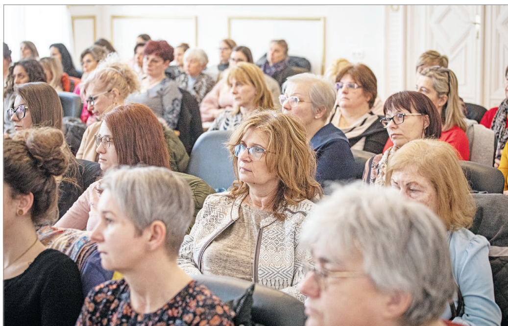
A társadalom csökkentheti az esélybeli különbségeket.

Kifejtette, vannak megismételhetetlen szakaszai a gyermekornak, amikor biztosítani lehet a képességek kibontakoztatását, a boldog felnőttkort – éppen emiatt ebben az időszakban a legnagyobb a társadalom és az oktatási intézmények felelős-