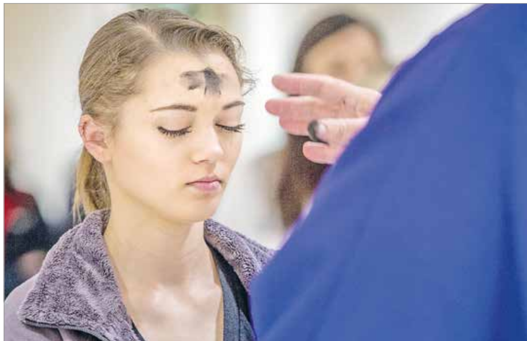
A hamvazószó története évezredekre nyúlik vissza

Persze az egyház sem várja el a lehetetlent, és tekintettel van az emberek életkorára vagy testi állapotára is, ezért mentességet ad - amit nem kötelező elfogadni - a 18 év alattiaknak, a 60 év fölöttieknek, a betegeknek, az állapotos nőknek, a szoptató anyáknak és egyes foglalkozások gyakorló-