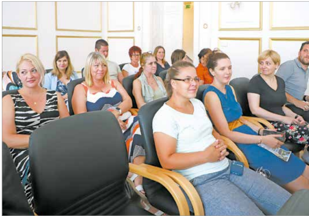
A projektnyitó rendezvény résztvevőinek egy csoportja.