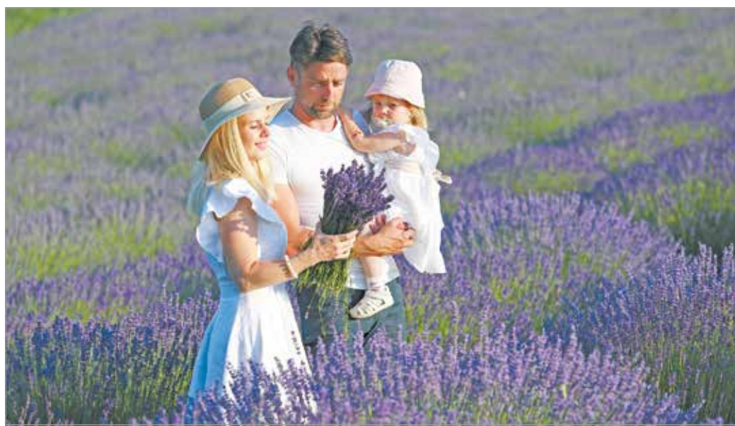
Alsódobozán, a Kerekdombi Levendula Kertben.

A mára egész Európában elterjedt kékeslilás színű levendulát már az ókorban is használták többnyire illatosításra, parfümként és gyógynövényként. A források szerint termesztését valószínűleg először az arabok honosították meg, azután Görögországból indulva terjedt el az öreg kontinensen feltehetően I. e. 600 körül. Ebben az időben sok más gyógynövénygel együtt a kolostorok „gyógynövénykertjeiben” termesztették a levendulát. Magyarországon is először a kolostorkertekben jelent meg, de csak a középkorban. Mint parfümnövény a 19. században vált igazán elterjedté, főként Angliában és Franciaországban. Hazánkban 1920-ban dr. Bittera Gyula gyógynövénytermesztő, vegyész és ipari mérnök kezdte el a kereskedelmi célú termesztését Tihanyban, aki egyenesen Provanca-ból hozta a vetőmagot. A '90-es években azonban országunkba is elterjedt és azóta reneszanszába éli hazánkban, „ami egyfelől az éghajlatváltozásnak, másfelől a növény igénytelenségének és alkalmazkodóképességének köszönhető, hiszen kife-