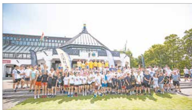
Nagy érdeklődés kísérte a sportrendezvényt.

A rendezvény idén szintet lépett, és a sport, a ko-