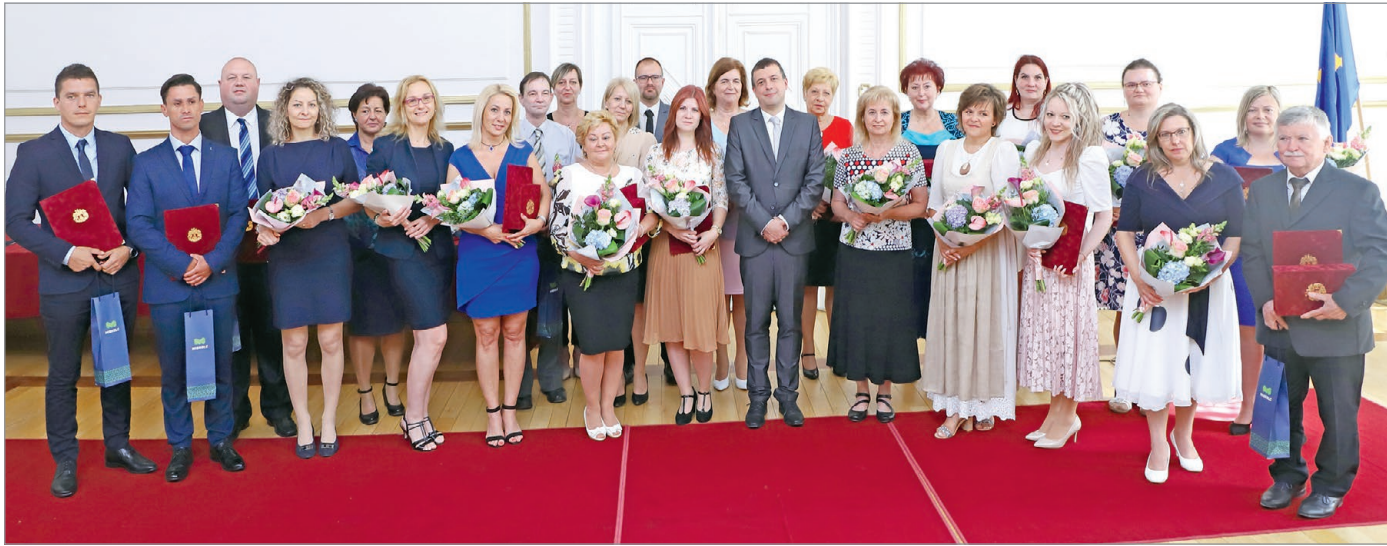
Az elismerésben, kitüntetésben részesültek.

A köztisztviselők napja alkalmából a városházán kiemelt munkájuk elismeréséért a polgármesteri hivatal dolgozói közül kilencen Elismerő Oklevél kitüntetés, heten a Jó Munkáért elismerő oklevelet, hatan az Év Köztisztviselője elismerő címet vehettek át, négyen Életműdíjban részesültek.