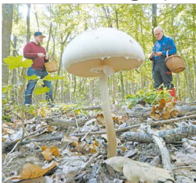
Gombából időnként sok terem.

– Sokan pusztán tudásvágyból és saját költségeiken végzik el a képzést, de egyébként más területen dolgoznak. Az idősebb generáció tagjai kiöregednek, egészségügyi prob-