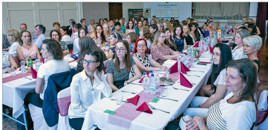
Az ünnepeltek egy csoportja.