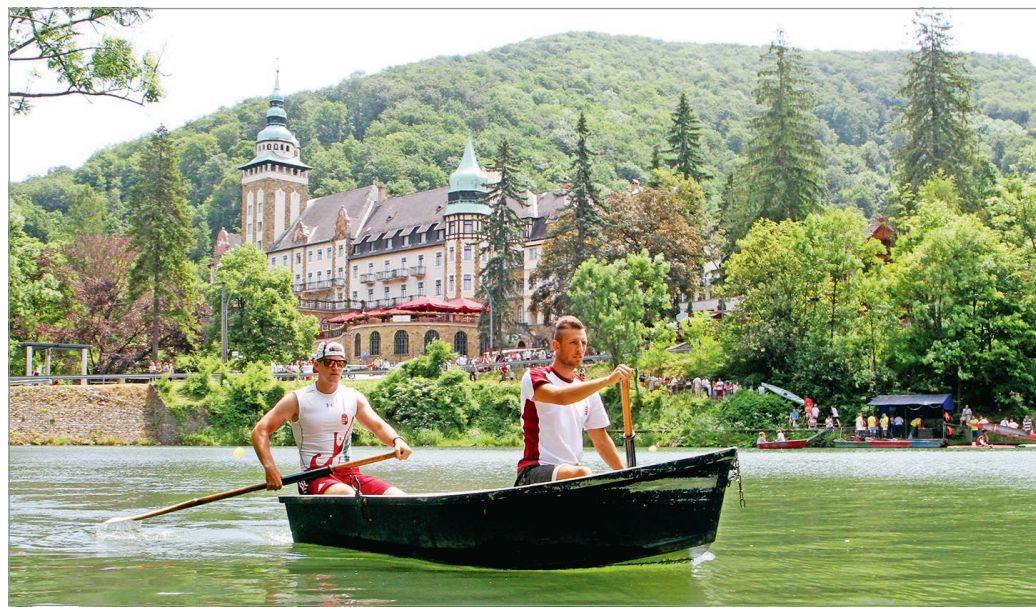
A Hámori-tó mindig népszerű.

Az idén felújítás miatt nem tudjuk megmutatni az ideérkezőknek a Diósgyőri várat, az Avasi kilátót – ami azért még így, a rekonstrukció alatt is impozáns látványt nyújt, és megszűröl is kiválóan látszik – és az Ellipszomot. De az ideérkezők nem is hiányolják ezeket, hiszen a város kínálata így is több napra nyújt változatos lehetőségeket. Gondoljunk csak a Szenthárom-