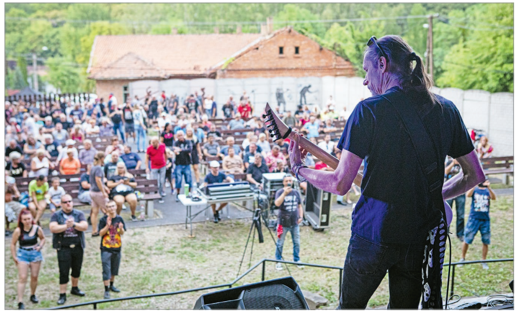
Augusztus 12-én ismét zenészekkel telik meg a perecesi szabadtéri színpad.

– A Perecesi Rockfesztiválon mindig öt zenekar lép fel. A Kiss Csaba és barátai zenekar, valamint az Excelsior évről évre visszatér a szabadtéri színpadra, a másik három fellépő viszont mindig változik, így biztosított az, hogy a közönség mindig változatos rockzenét hallhasson. Idén a Power Of Cover, az Ageless és a B. M. V. érkezik majd – sorolta Kiss