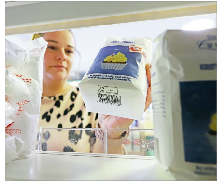
Örök téma a cukor ára.

A Lidlnél egyelőre még nem sok változás tapasztalható. Mint azt a cég a Telex megkeresésére közölte: törvényi kötelezettségüknek megfelelően három termék kategóriában tovább csökkentették áraikat, a többi árstoppal érintett termékeik árát szerdán módosították. A vállalat központilag szabályozza az akció folyamatát. A portál kérdésére a Tesco azt írta, hogy náluk a pultos csirkemell kilogrammos egységára augusztus