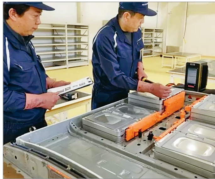
Jönnek a vendégmunkások.

Legalábbis minden ebbe az irányba mutat ilyen vagy olyan módon. A kormány a tervek szintjén pályára állította az országot, és a szervezett ellentüntetéseket is el-elmaradoznak. Igaz, Fót megmenekült, nem lesz akkuváros, ezt Vass György , fideszes polgármester jelentette be, hozzátéve, a fóti önkormányzat több hónapos munkájának eredménye, hogy a HelloParks nyilatkozatban vállalta, hogy a településen a jövőben nem köt bérleti szerződést akkumulátorcellák gyártásával foglalkozó vállalattal. Mégis úgy tűnik, hogy a gyárak nem mindenütt ütköznek ellenállásba. Az elképzelés, ami Debrecen esetében még országos felháborodást és élőláncos tiltakozást generált, az Nyíregyházára már szinte kivajazott úton, csöndben siklott be. Nemrég bejelentették ugyanis, hogy az egyik legnagyobb kínai akkumulátorgyártó, a Sunwoda 580 milliárd forint értékű beruházással a szabolcs-szatmár-beregi vármegyeszékhelyen építi fel az új üzemét. Már ez a gigabefektetés is sok kérdést vet fel, de közel sem Nyíregyházán van a lítiumion-akkumulátorokkal kikövezett út vége. Sőt, Debrecen akár duplázhathat is, hiszen a Portfolio szerint a Ningbo Zhenyu Technology nevű cég mintegy 23 milliárd forintos