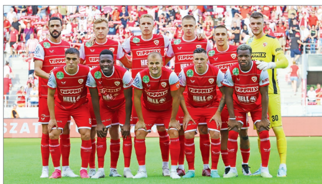
A Puskás Akadémia elleni kezdőcsapat sokat nem változhat.