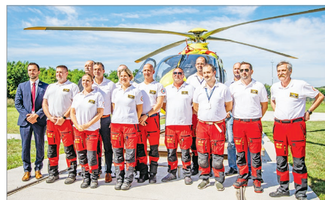
Együtt a légimentő bázis személyzete.

A legjelentősebb változás, hogy felépítettek egy fűthető hangárt, ami azért fontos – hangsúlyozta Gebei Róbert orvosigazgató –, mert télen is sokkal gyorsabban el lehet indítani a mentőhelikoptert.