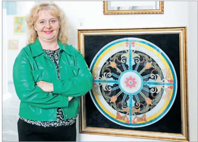
A különleges kiállításon negyven színes üvegfestmény látható.