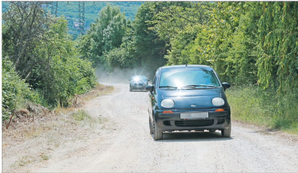
A zúzalékos utak fejlesztése rendkívül komplex feladat és nem csak azért, mert nagyon sokba kerül.