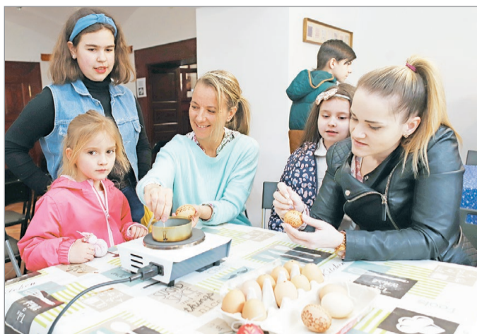
A látogatókat kézműves programok is várják.

Görömböly és Diósgyőr mellett a Népkertben is az ünnepek kerülnek a fókuszba, ahol Húsvéti Kavalkádot rendeznek március 31-én, vasárnap. Ennek keretében igazi Húsvét-szigetként válik majd Miskolc legelsőbb parkja. Persze nem a polinéz kultúra nyújtott fejű szobraival találkozhatnak a látogatók, sokkal inkább a keresztény kultúrkör egyik legnagyobb ünnepének szimbólumaival: hímes tojással, locsolkodással, árusokkal, koncertekkel, előadásokkal és tematikus programokkal. Lesz talpalávaló a kis cipőknek, és zene, amire a nagyobb láb-