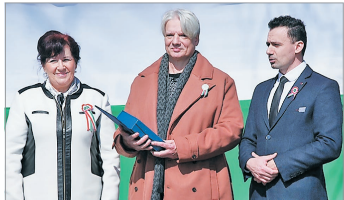
A Spanyolnátha főszerkesztője március 15-én vette át Hernádkak díszpolgári címét.