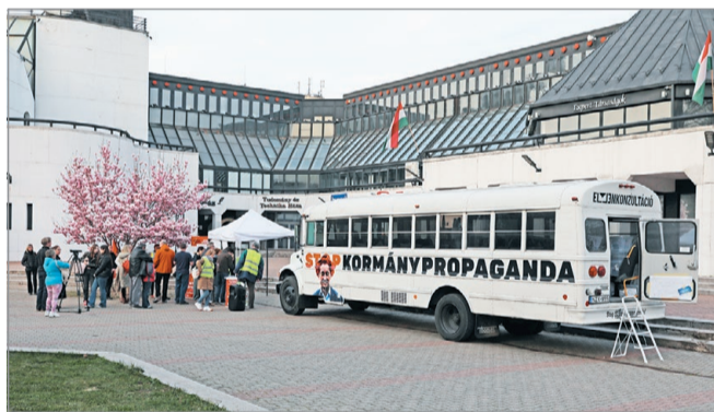
Miskolcon járt csütörtökön a „STOP kormánypropaganda”-iskolabusz.

Kora este végül Dusza Erika újságíró moderálásában kerekasztal-beszélgetést is tartottak egy meghívott vendég társaságában – megtalálható a válaszokat, hogyan