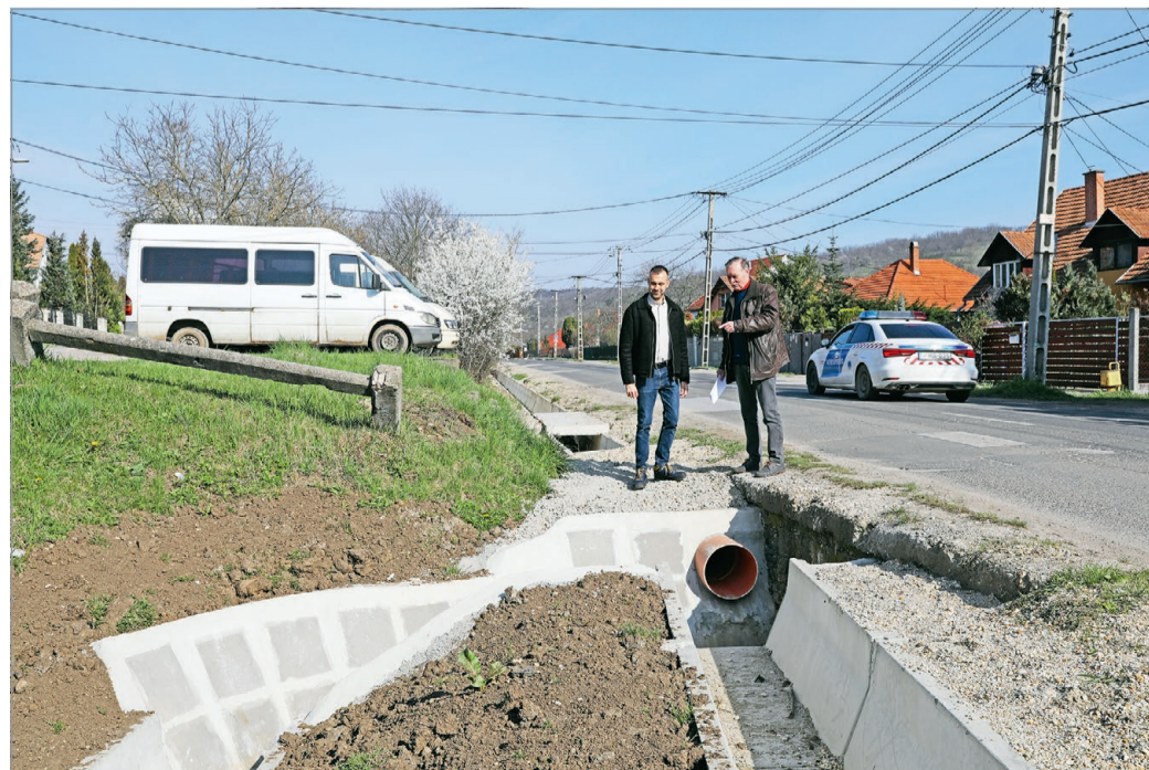
A városrészben korábban teljesen hiányzott az útmenti vízelvezetés.

– Június végére várható a kátyúzás befejezése a város teljes területén, amire több mint 300 millió forintot tudunk fordítani. Jelenleg Perecesen is folynak a munkálatok a Bertalan utcában. Itt is lakossági, illetve önkormányzati bejelentések és az útellenőrző szolgálat felmérése alapján készült el az ütemterv, ami körülbelül 31 utcát érint ebben a városrészben – részletezte. MN