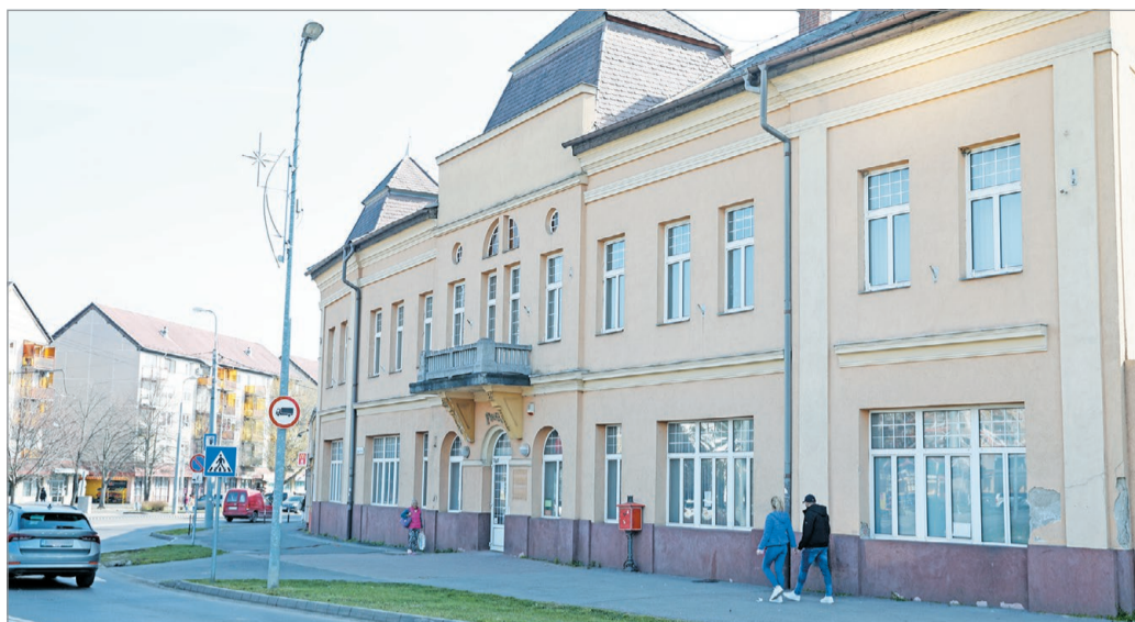
Az Újgyőri főtéren található 9-es posta másfél évvel ezelőtt zárt be, és bár a Magyar Posta továbbra is vonakodik újrainyitni, az épület hasznosítására már születnek ötletek.