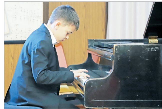
A rendezvényen egressys és erkeles diákok léptek fel.