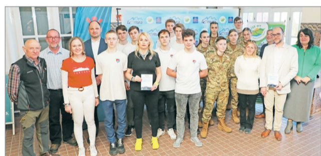
Idén is népszerű volt a Tortúra teljesítménytúra.