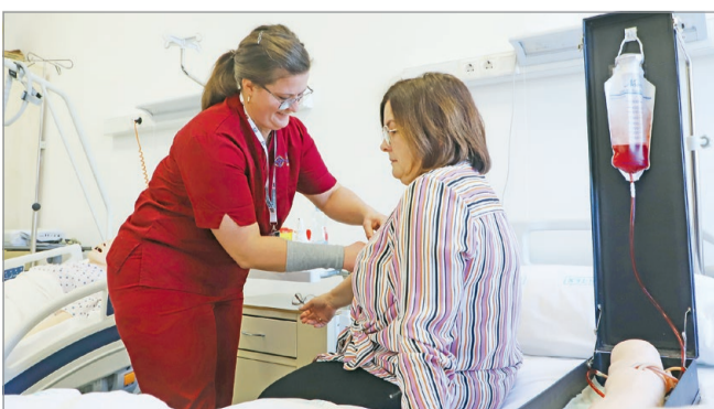
A diákoknak szimulációs eszközök segítségével kellett bemutatniuk a feladathoz tartozó tevékenységeket.