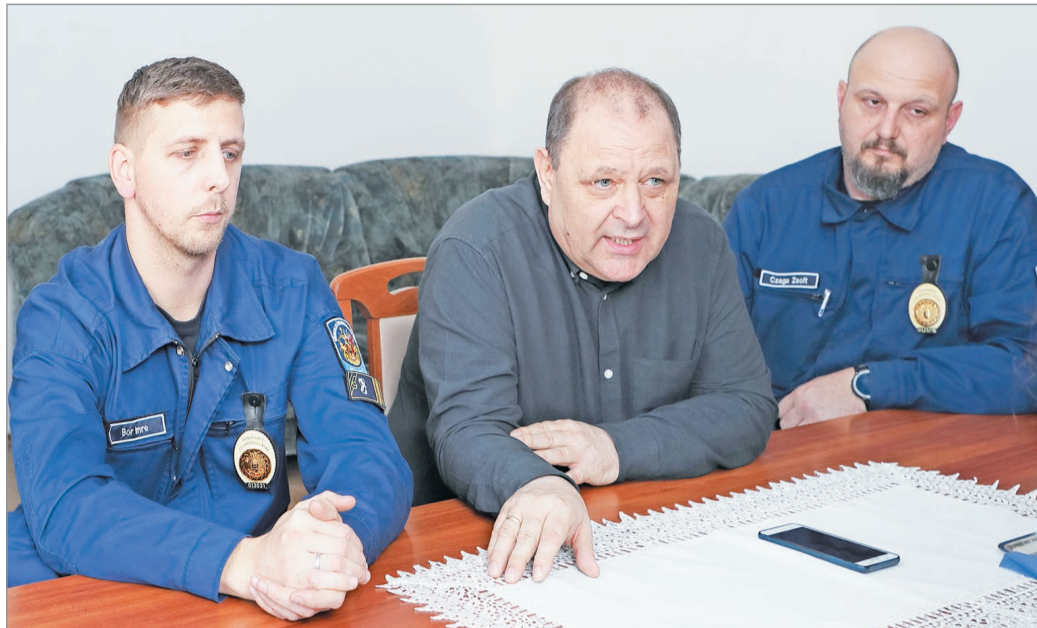
A nap huszonegy órájában felügyelik Miskolc közterületeit.