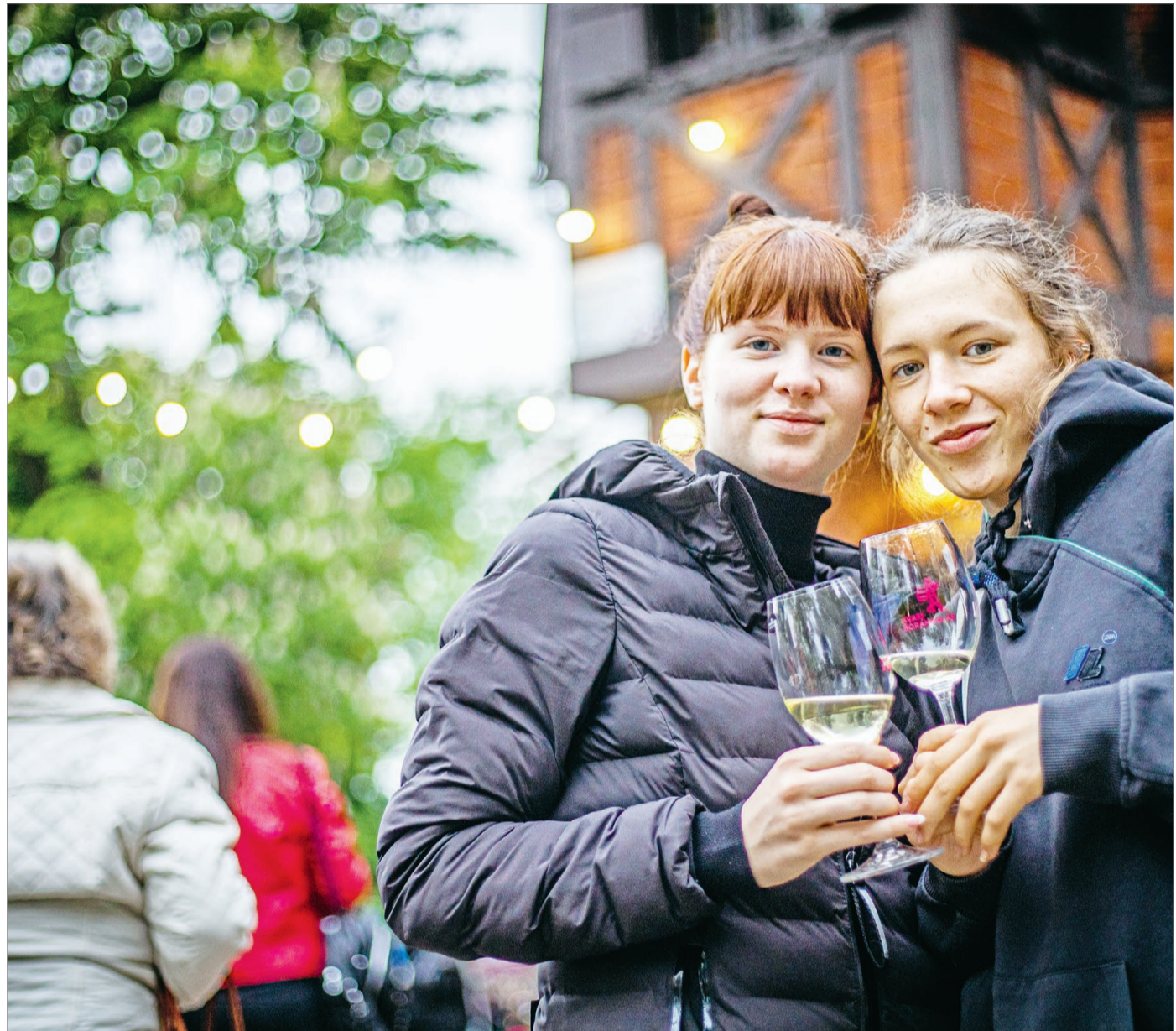
Bár a kezdet kezdetén volt aki kételkedett benne, mára egyértelmű sikertörténet a Borangolás.

Kezd újra rátalálni a bortörténelmére a város: az elhanyagolt pincesorokra bő tíz év alatt visszaköltözött az élet.