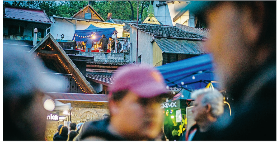
A programok fő célja a kezdetektől az, hogy felébresszék Csipkerózsika-álmából az Avast.

Magyar László szerint a város is igyekszik hozzátenni, amit tud. Az eredményt pedig nemzetközi szinten is elismerték: a 100 legjobb jógyakorlat közé került Miskolc pályázata a Green Destina-