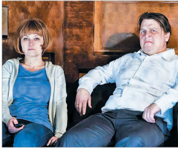
Állami elismerést kaphatott volna akár Fandl Ferenc is.

Egyfelől az Orbán Viktor által kijelölt bizottság listája és a