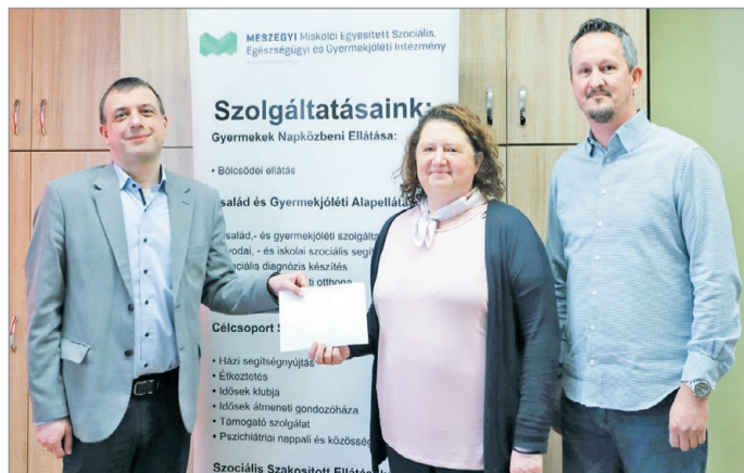
A polgármesteri hivatal dolgozói évek óta segítenek a civileknek.