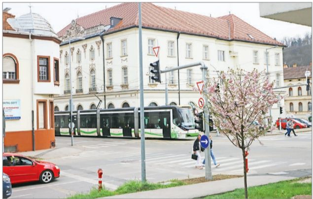
Rövidesen újraprogramozzák a jelzőlámpákat.

Ahogy arról több ízben beszámoltunk, a városháza illetékes főosztálya több lehetőséget is vizsgált az átkötésnél kialakult dugók megszüntetésére. Az egyik a Dayka és a Petőfi utca forgalmi rendjének átalakítása. A pár hónapja átadott kereszteződésben jelenleg a Daykáról csak egy sávon halad a forgalom a Petőfin át Diósgyőr felé – a módosítást követően viszont mindkét meglévő sávból lehetne balra kanyarodni. Sokan javasolták a városfejlesztési főosztálynak azt is, hogy engedélyezzék újra az autós forgalom áthaladását az átépítéskor forgalomcsillapított zónának átalakított Rácz György és Petőfi Sándor utcán. Ezt a megoldást szintén vizsgálta a főosztály és a közlekedésszervező csoport, az azonnali bevezetése viszont nem lehetséges. MN