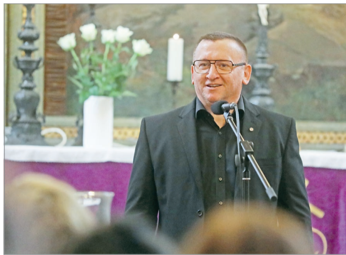
Vigh Roland szerint időszerű volt, hogy Miskolcra érkezzen a találkozó.

ködet helyben kialakítottuk: az egyházi vezetőket rendszeresen egy asztalhoz tudjuk ültetni, megbeszélni a közösségek ügyeit, az egri érsektől a miskolci főrabbiig – szögezte le a városvezető.