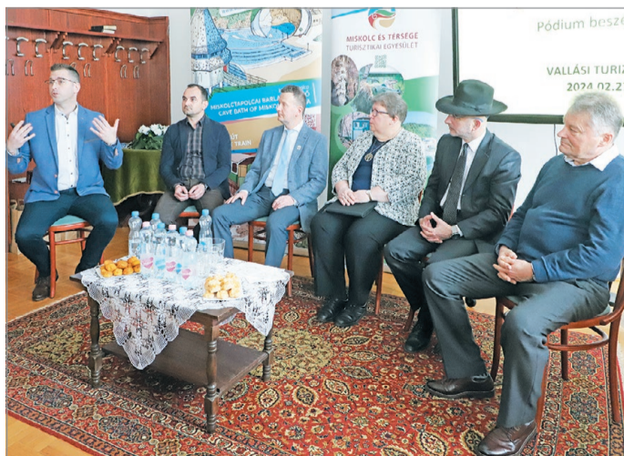
A lehetőségekről és a kihívásokról beszélgettek az érintett vallási közösségek képviselői.