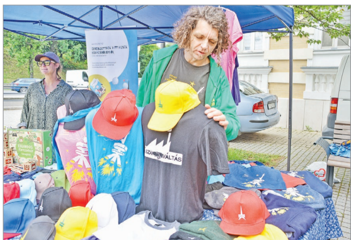
Hamar népszerűek lettek az Avasi kilátót ábrázoló pólók, pulóverek vagy sapkák.