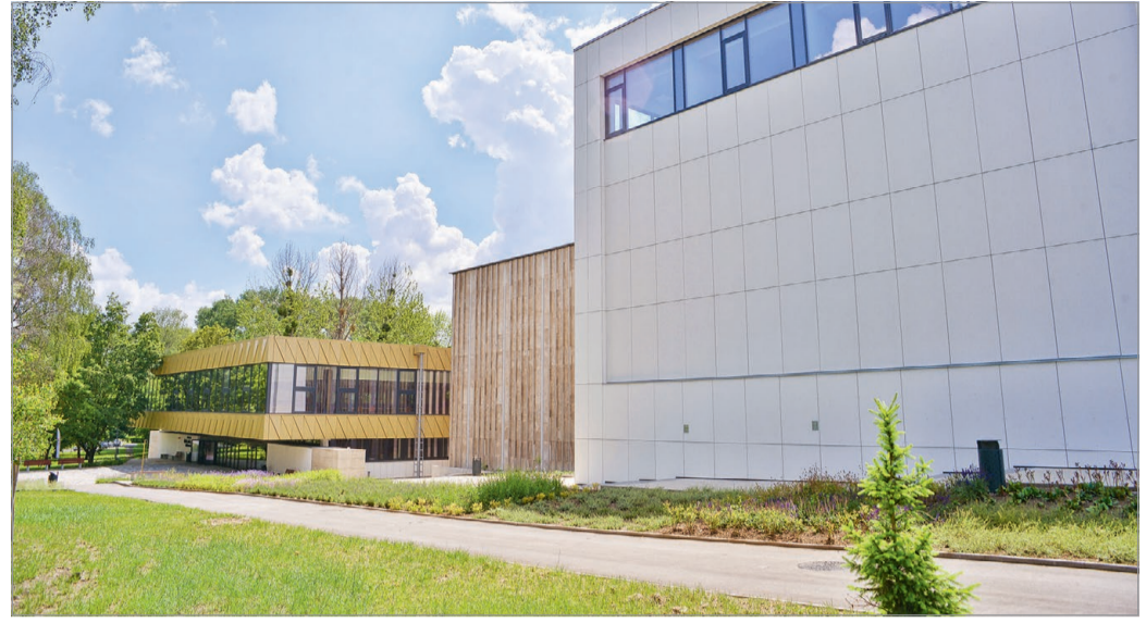
A megújult és kibővült épületet hamarosan ismét birtokba veszik az oktatók és a hallgatók is.

„Az egyetemi könyvtár korábbi épületét Tolnay Lajos építész álmodta meg 1963-ban, amiért később Ybl-díjat kapott. Ezzel a Miskolci Egyetem, Könyvtár, Múzeum és Levéltár hazánk épített örökségének részévé vált. Több mint ötven évet