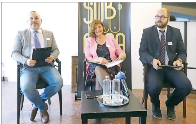
Miskolcot mindenek fölé helyezik.

A környezetet nem terhelő, jól fizető munkahelyeket hoznak Miskolcra. A lakhatást is javítanák, hogy a rendőrök, orvosok, pedagógusok, fiatal szakemberek számára megkönnyítsék az itt maradását. Újabb óvodákat, iskolákat újítanak fel, oktatási alapot hoznak létre, és rezidens programot indítanak a házi gyermekorvosok képzésének támogatására.