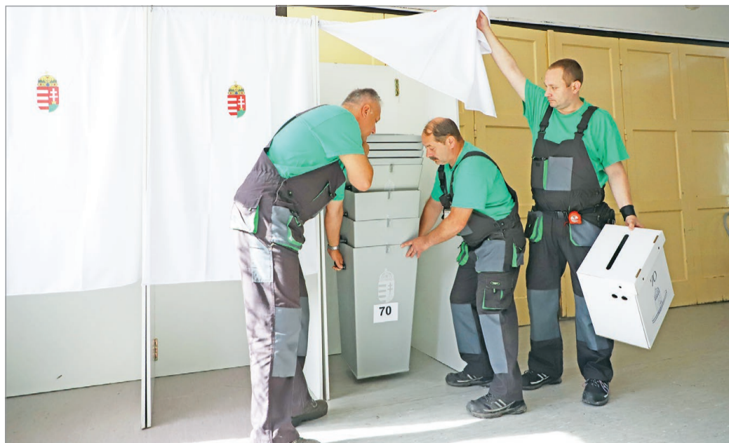
Városszerte szerelik a szavazófülkéket.

Ignác Dávid felidézte: tavaly hét vidéki nagyvárosban, köz-