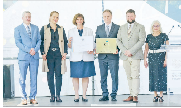
A díjat múlt hétfőn adták át a 27. Múzeumok Majálisán Budapesten.

Az idén százhuszonöt éves intézményben számos fejlesztés történt az elmúlt esztendőben: a múzeum Tímármalom utcai épületében idén januárban megnyílt az a Régészeti Látványtár, ami egyedülálló tárlatával és múzeumpedagógiai foglalkozásaival rengeteg látogatót vonz azóta is, majd április végén átadták a Képtárat is.