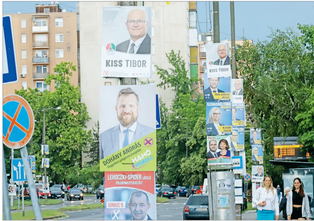
Jelöltekből nincs hiány.

A 47 éves cégvezetőnek három gyermeke van. Azt írta, felelőtlen ígéretek nem tesznek, programjában közösségi kertek, esővízgyűjtő-program, fásítás szerepel. Kátyu- és hibabejelentő applikációt indítana a Városgazdánál. Aztán: visszaállítaná a közösségi közlekedésben a 2019 előtti jól működő menetrendet. A teljesen ingyenes tömegközlekedésben nem hisz (csak 14 év alatt és 65 felett legyen ingyenes), mert akkor nem lesz pénz fejlesztésekre. – Látjuk, mi lett a rezsicsökkentés vég-