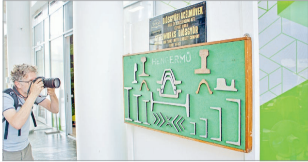
A jubileum kapcsán nyílt tematikus tárlat a városháza aulájában tekinthető meg.