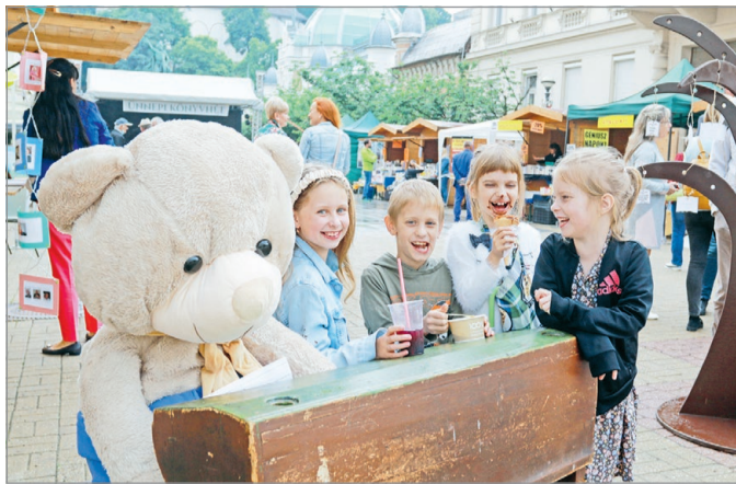
Kicsik és nagyok egyaránt találhatnak könyves programokat.

Három napra az Erzsébet tér újra átalakul könyvtérre: tucattól is több könyvkiadó és áruház települ majd ki a belvárosba, és kínálja újdonságait.