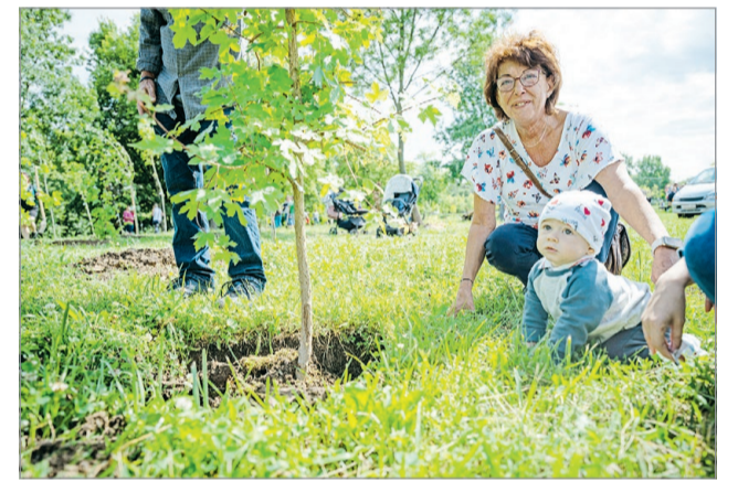
Együtt ültettek a családok az Avason.

– Tudtuk, hogy nagy hagyománya van az Avason a faültetésnek, reméltük is, hogy részesei lehetünk a programnak. Nagyon örültünk hát, amikor megkérdezték tőlünk, szeretnénk-e fát. Ezzel is kicsit zöldebbé tesszük a környezetünket – fogalmazott az édesanya. MN