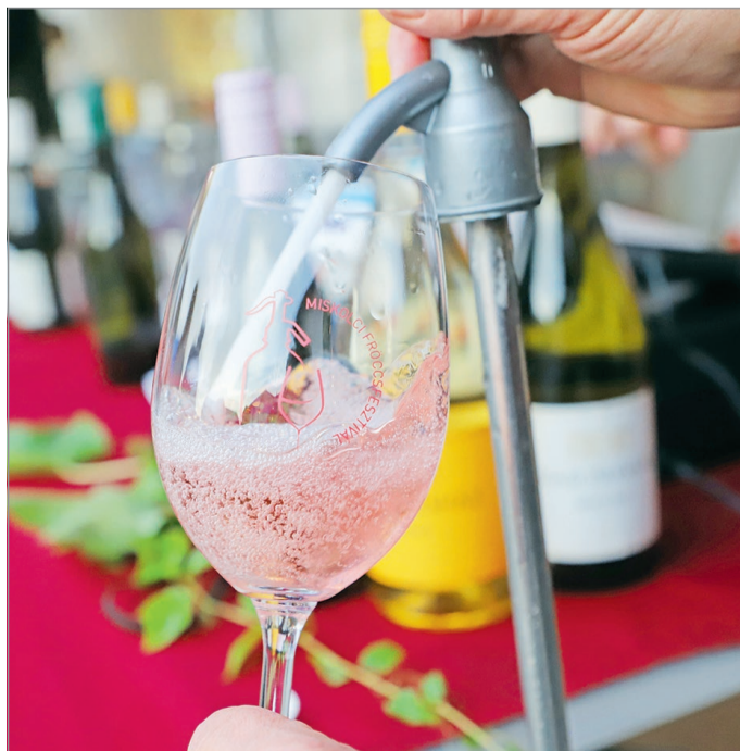
A fröccsfesztivált is támogatja az önkormányzat.