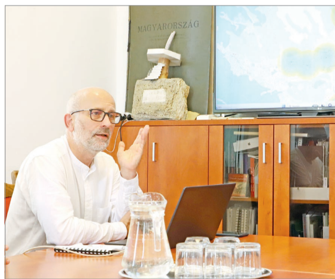
Emberléptékűvé teszik a közlekedést.

Ezek nem pusztán a város tervezéséhez és a városvezetők döntéseinek megalapozásához szolgálnak majd kapaszkodóként, de hamar a fejlesztések társadalmisításának az eszkö-