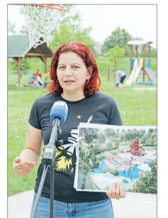
Szabadidőparkot terveznek a Berek kertbe.