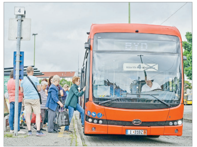
Sokaknak tetszik az MVK új elektromos busza.

Kedden szerkesztőségünk tagjai is tesztelték az új buszt, egy 10:15-kor, a Búza térről induló 4-esnek megfelelő járaton, amely Görömbölyre viszi ki az utasokat. Visszafelé normál autóbusszal jöttünk, hogy a kettőt össze tudjuk hasonlítani.