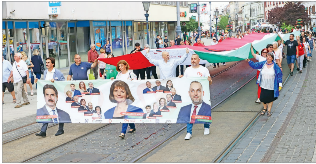
A Centrumtól a Városház térig vonultak.

– Azt gondoltam, hogy az, amiben eddig hittem, amiért minden egyes nap kitarotán dolgoztam, az a sikeres, nyugat-európai szellemiségű, átfogó gaz-