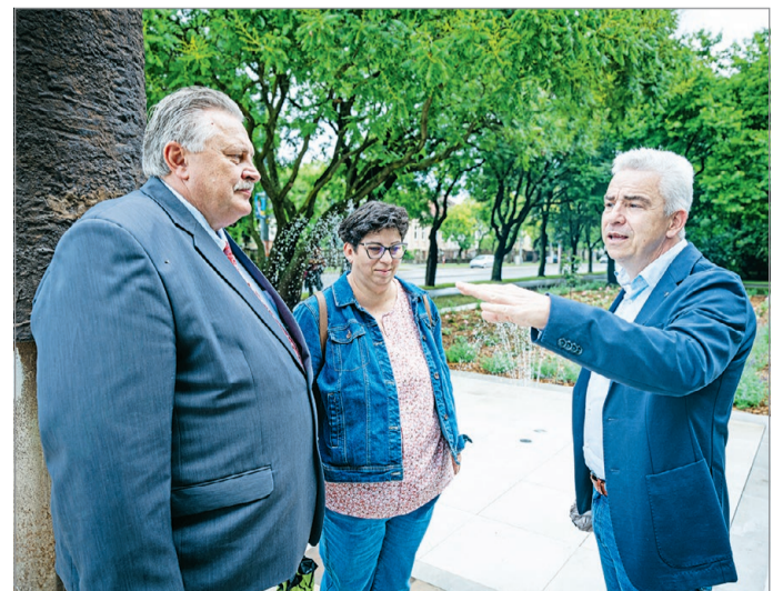
A terület önkormányzati képviselője a polgármesterrel és a főker-tésszel tekintette meg a fejlesztést.