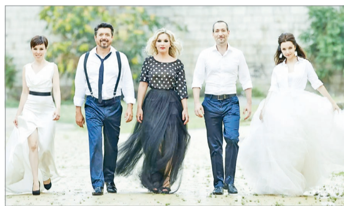
A Cotton Club Singers szombaton lép fel a Csengey-kertben

capella, azaz hangszeres kíséret nélkül énekel majd. Repertoárjukban a '20-as, '30-as évek amerikai zenéje, világslágerek és spirituálék szerepelnek, de előszeretettel dolgoznak fel magyar slágereket is. A szombat estét a Lévay József Református Gimnázium énekegyüttese, a Lévay Vokál indítja. Őket az AdHoc Vokál követi. A szombati nap sem maradhat sztárfellépő nélkül, így este 8 órától a Cotton Club Singers lép a MÜHA Csengey-kert világot jelentő deszkáira. A '90-es évek közepén alakult együttes a kis mulatóktól eljutott