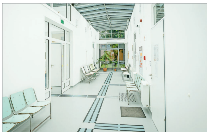
Modern egészségház épült a Dél-Kiliánban.