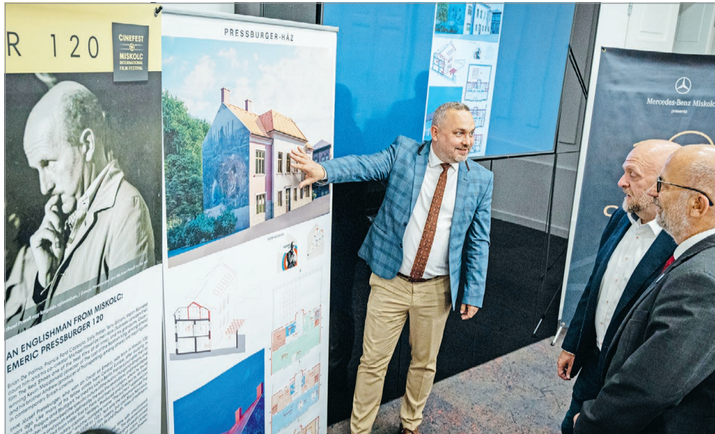
Kis híján az enyészete lett az épület, de hamarosan pincétől a padlásig felújíthatják.

Miskolc polgármestere hoztatta, az idén huszadik alkalommal tartandó miskolci