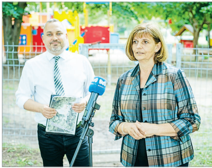
Sajtótájékoztató keretében mutatták be a terveket.