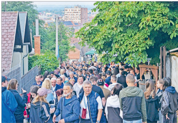
Csak szombaton 18 ezren voltak a hegyen.

Május harmadik hétvégéjén 18 vendégház hely finomságait kóstolhattuk, 70 fellépő különböző stílusokban szórakoztatta a borangolókat, akik 32 ezerszer ölelték meg egymást, de egy idő után a szeretetszámláló bizottság feladta az örömteli találkozások számontartását. A vasárnapi