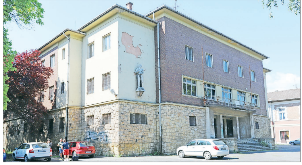
Az épület hosszú évek óta üresen áll.

– Megszereztük az épület eredeti tervrajzait, melyekből kiderült, hogy azokat már a tervezési időszakban is többször módosították. Például a főépület középső szárnyán lett volna eredetileg egy torony, ez azonban nem épült meg végül, aminek az az oka, hogy az 1930-as években egy jelentősebb racionalizálás történt az építészet-