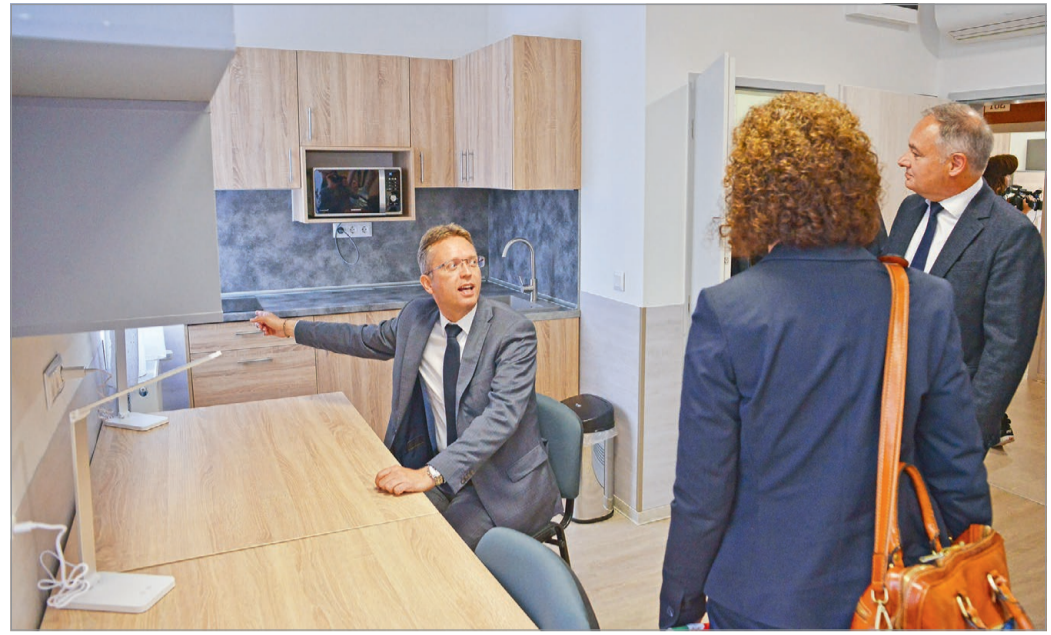
Az új szálláshelyeket elsőként az Európai Egyetemi Játékok sportolói használhatják majd.

Ez a kollégiumátadó tulajdonképpen az egyetem szellemi és fizikai építkezésének szimbóluma. Több tízmilliárdos állami támogatással felújítottuk és kibővítettük a könyvtárunkat, most átadtuk a kollégiumokat, és még júliusban birtokba vesszük a megújult sportinfrastruktúránkat is. És a fejlesztések nem fejeződtek be, hiszen másfél-két éven belül a kampusz 90 hektáros területén valamennyi épület és egyéb infrastruktúra megújul. Lesz olyan is, ahol új épületet hozunk létre, mindezt úgy,