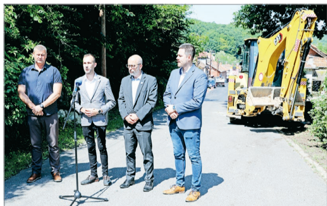
Nagyot tudott előrelépni Perecs.