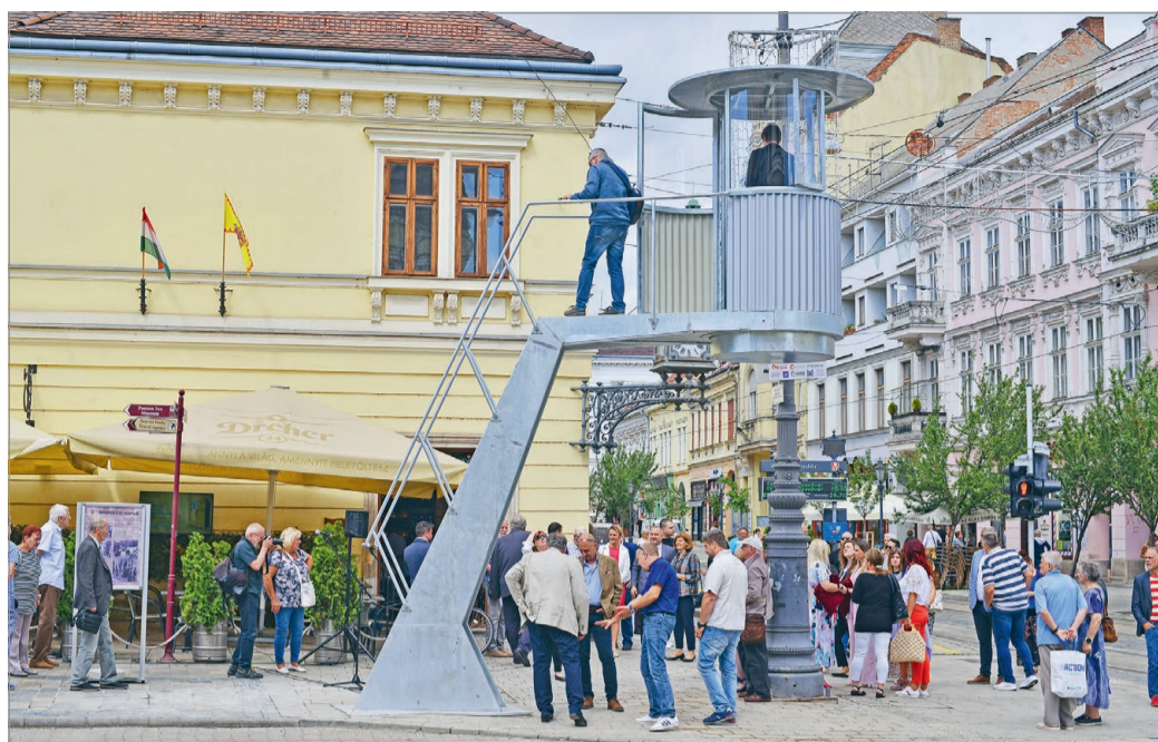
Ami összeköt minket – átadták a villanyrendőrt.