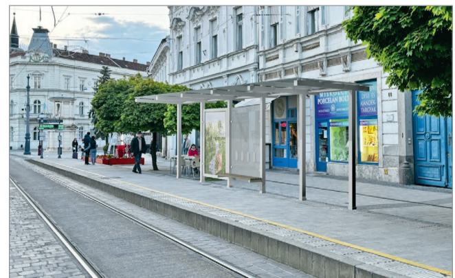
Még az őszi esőzések előtt átadják a villamosvárókat