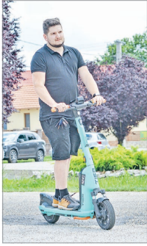
Elindulás előtt ellenőrizzük a töltöttséget.

Az alpolgármester bejelentette, hogy mivel jelentősen bővült a kerékpárút-hálózat Miskolcon, mindenhol eléri a város közigazgatási határát és becsatlakozik az országos hálózatba, így megnyílt a lehetőség az e-roller-szolgáltatás kiterjesztésére.