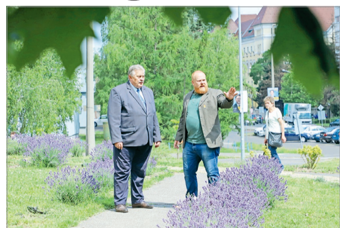
A Vologdán pihenőparkot alakítanak ki.

– A TOP Plusz pályázatok közé bekerülhet ennek a területnek a fejlesztése is. Úgy gondolom, hogy megfelelő sértányok kialakításával, kerék-