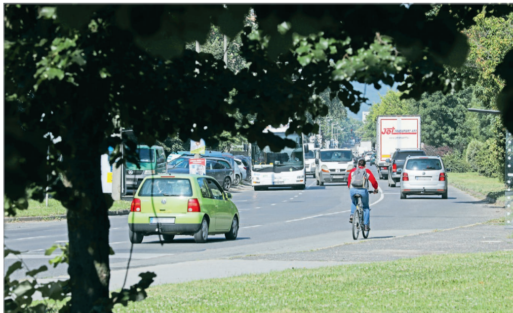
Az Északi tehermentesítő az egyik legnagyobb problémaforrás az autósok számára.

– Ahhoz, hogy be tudjuk zárni a belvárost elkertülő – mondjuk úgy – körgyűrűt, és kintebb tudjuk szorítani a belvárosból az autósokat, szükség van erre a