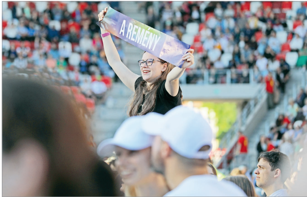
A remény betöltötte a teret és a jelenlévők szívét is.

– Megszólt a szívemben egy imádság, egy vágy: bár csak megadná Isten egy napon, hogy a Jézus neve feletti öröm