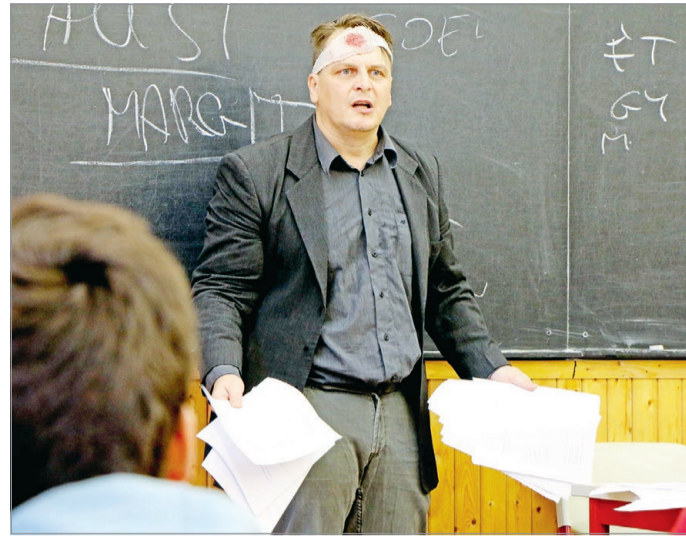
A vármegye középiskoláinak háromnegyedébe már elvitték a teátrumot.