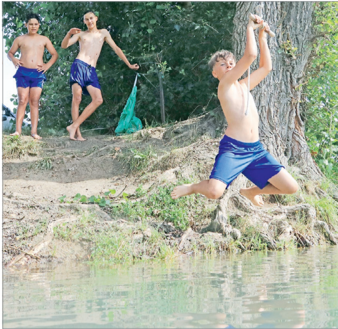
A szabadvizeken fogadjuk meg a szakemberek tanácsait.

A nyitást az Arló Suvadás Liget, a RádióM Mályi Plázs, a Muhi, RealXtreme Víziparadicsom, valamint a Vadna-Park Üdülőközpont 1. és 2. strand jelentette be. Közölték azt is, hogy a már nyitva tartó mályi és muhi fürdőhelyek szezon előtti vizsgálati eredménye kiváló, az arlói strandé pedig jó. A Vadnán található strandok szezon előtti mintáit még vizsgálják, a várhatóan kinyitó nyékládházi fürdőhely vizsgálati eredménye pedig