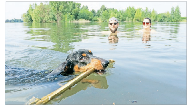
Veszélyeket is rejt a tavakban való fürdőzés.