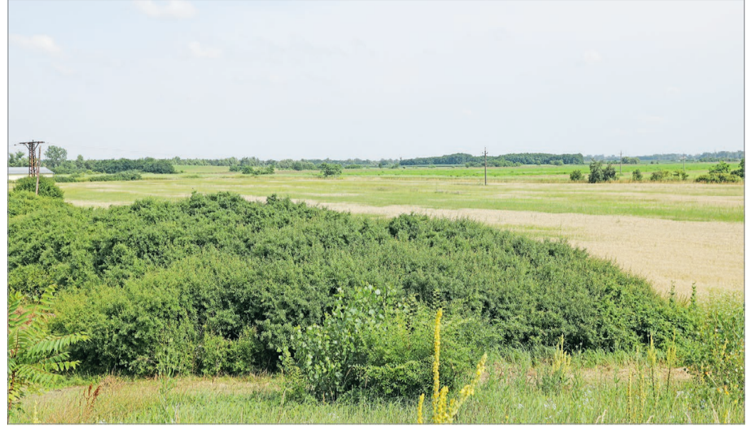
A korábbi reptértől nem messze, a Csorba-tavak környékén épülhet az új kifutópálya.

Két esztendővel ezelőtt ejtőernyős ugrásokkal, látványos