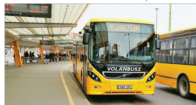
Népszerű az online fizetés a távolsági buszokon.

Mint jelezték a szolgáltatásbővítéstől a MÁV-VO-LÁN-csoport az utaskiszolgálás folyamatának gyorsulását és a működési költségek csökkentését is várja. DA