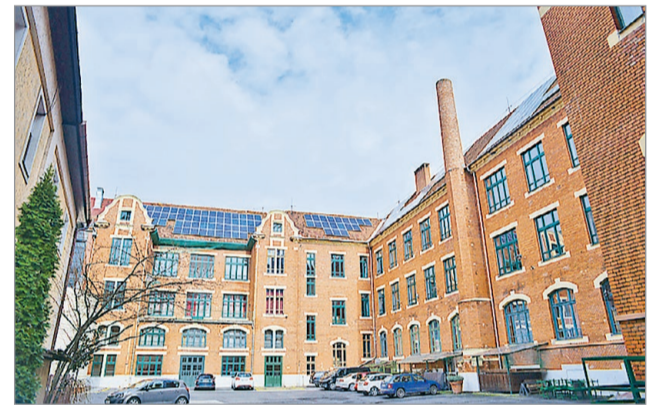
Ősztől új fenntartója van a Földesnek.