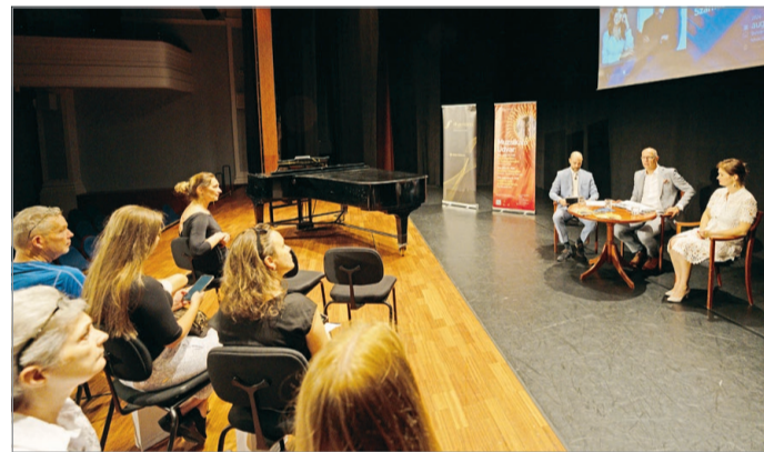
A programokról csütörtökön számoltak be.