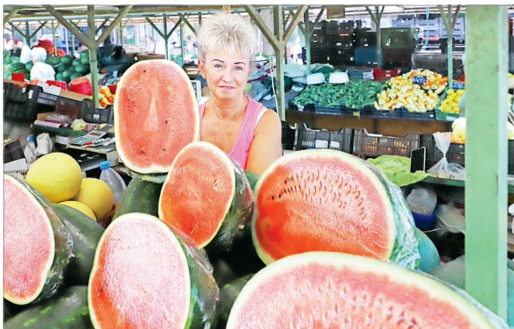
Bőséges az idei dinnyetermés.