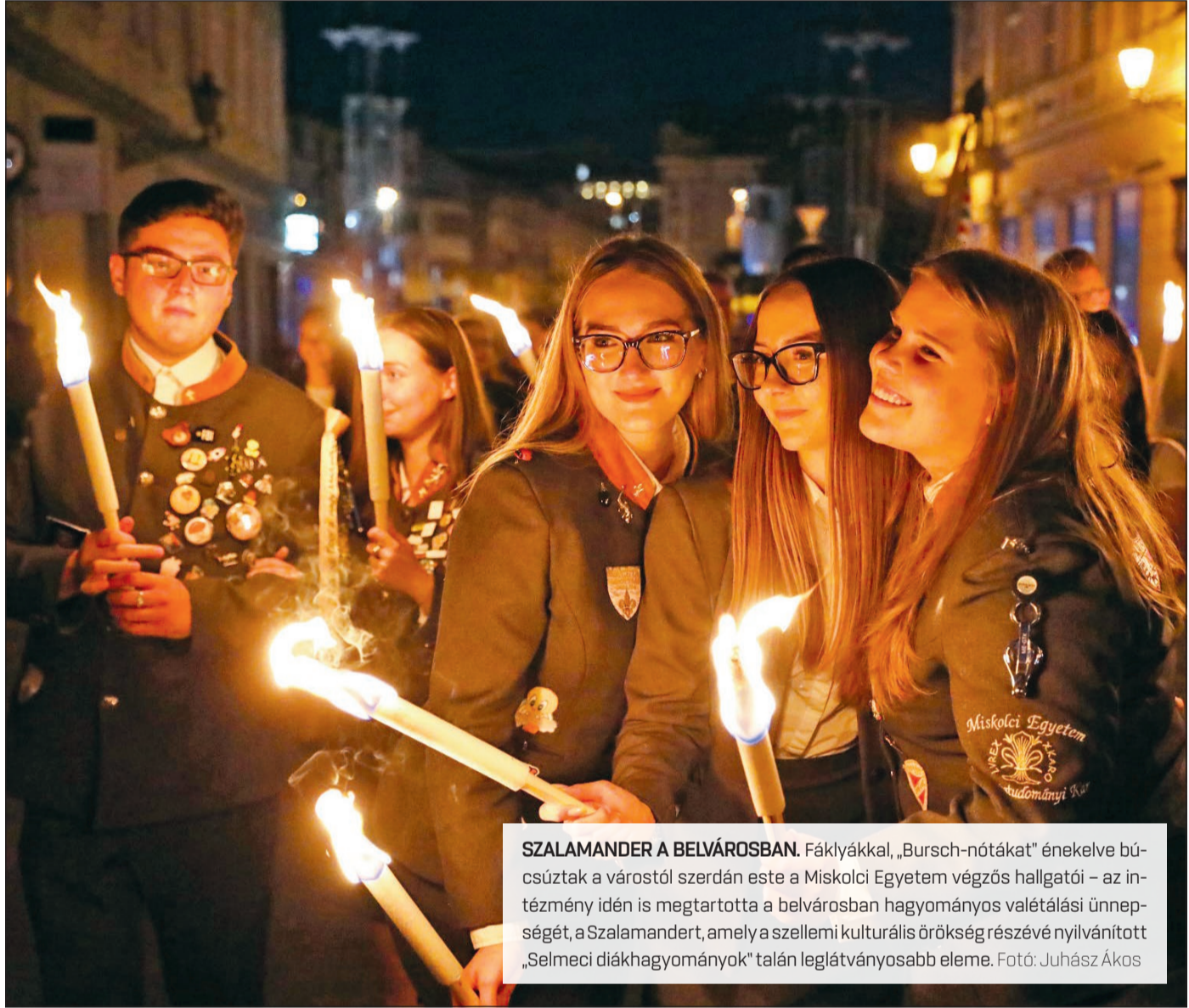
SZALAMANDER A BELVÁROSBAN. Fáklyákkal, „Bursch-nótákat” énekelve bücsűztak a várostól szerdán este a Miskolci Egyetem végzős hallgatói – az intézmény idén is megtartotta a belvárosban hagyományos valétalási ünnepségét, a Szalamandert, amely a szellemi kulturális örökség részévé nyilvánított „Selmeczi diákhagyományok” talán leglátványosabb eleme.