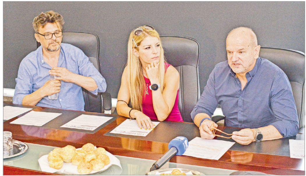
Az őszi évad előadásait sajtótájékoztatón jelentették be a szervezők.

– Rögtön egy különleges performansszal nyitunk majd. A ló meghal, a madarak kirepülnek: Kassák Lajos zseniális avantgárd versét szavalom majd el, ami önmagában képes elvinni egy estét. Azonban ezt ötven miskolci rajzszakos diák kíséri majd: azokat a benyomásokat örökítik meg, amiket a szöveg inspirál. Egy szobor is készül a vers hatására, sőt, Nagy Nándor korrepetitor mindeközben zongorán játszik majd. Mindezt pedig egy kamera fogja rögzíteni. Láthatjuk tehát, ahogyan ki-