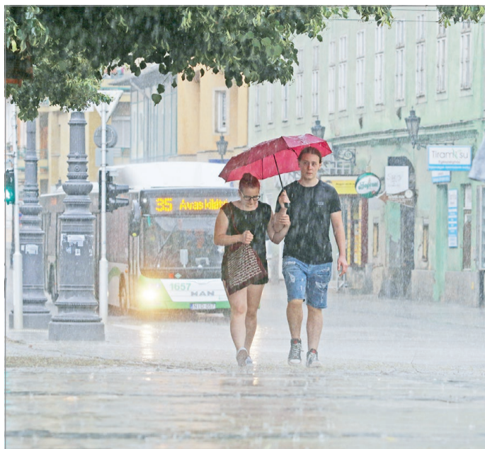
Felhőszakadás a belvárosban.

„A légkör fizikája és az azt leíró bonyolult egyenletrendszer a múlt évszázad óta ismeretes, de mivel matematikailag egyértelműen nem megoldható, csak közelíteni lehet a megoldást. Az informatika fejlődésével ugyanakkor egyre többfelé terjedtek el napi használatban is, számszerű modell-előrejelzések. Ezek egy része globális, hiszen a légköri folyamatok az egész Földre kiterjednek. Léteznek regionális modell-előrejelzések, amelyek nálunk jellemzően a környező, szomszédos országokat fedik le. Ezekből dolgozik a meteorológus: keresi azokat a légköri objektumokat, amelyek az adott