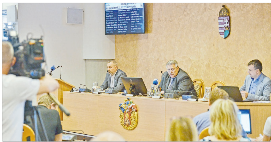
Másodszor is rendkívüli ülést hívtak össze júniusban.