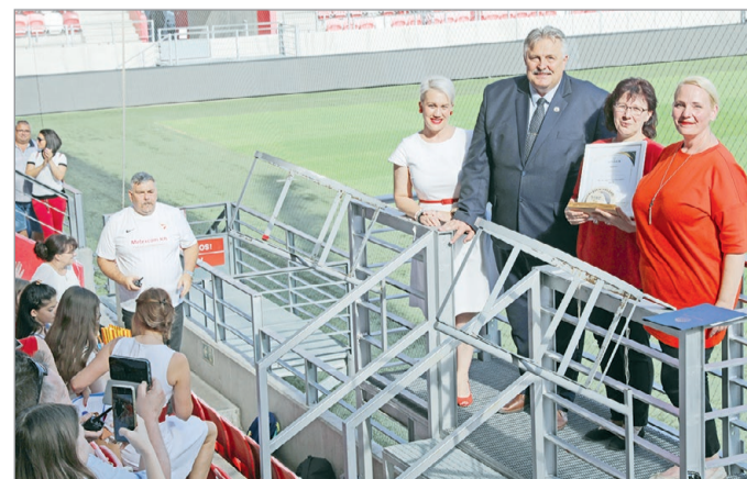
A díjazottakat közel nyolcvan jelölésből választotta ki a döntőbizottság.

A díjra a szülők anonim módon jelölhették azokat a pedagógusokat vagy oktatókat, akik az elmúlt egy évben innovatív szemlélettel és kiemelkedő közösségformáló tevékenységekkel örvendeztették meg a közösséget.