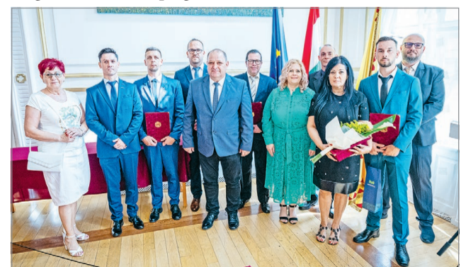
A köztisztviselőket köszöntötték.