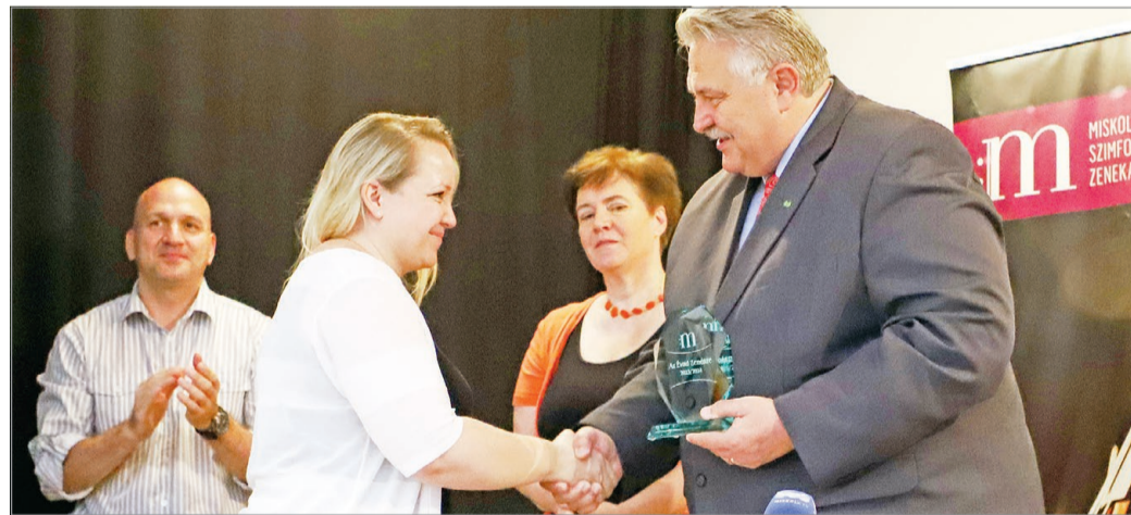
Idén is díjak, elismerések átadásával zárták az évadot.

– A teltház koncertek és a színes programkínálat önmagukért beszélnek. Köszönjük az áldozatos munkájukat! Tudom, hogy nehéz a művészek élete, és mi is döcögösen tudtuk követni a jövedelmi viszonyokat az infláció tükrében, ám igyekeztünk ezt a hiányosságot pótol-