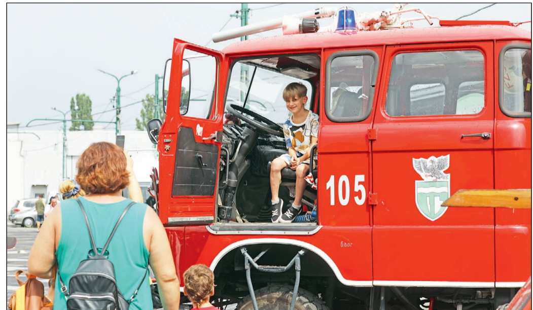
NOSTALGIA. A veterán járművek voltak a főszereplők a Miskolc Városi Közlekedési (MVK) Zrt. telephelyén múlt szombaton, a városi közlekedési cég is csatlakozott ugyanis a Múzeumok éjszakája program-sorozathoz. Az eseményen számtalan régi jármű várta az érdeklődőket, köztük természetesen az MVK nosztalgibuszai, régi villamosai is.