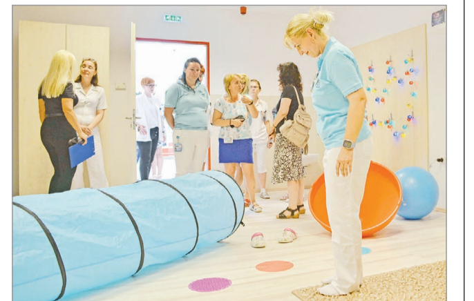
A szoba jó hatással van a gyerekek egészségére.