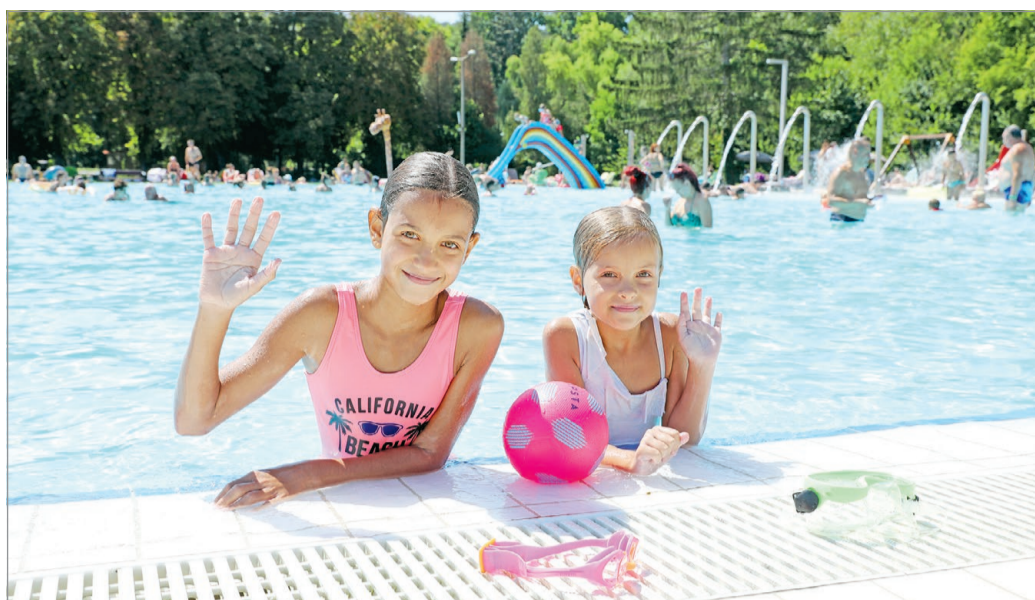
Korosztálytól függetlenül népszerűek a miskolci fürdők.

Vihula Mihajlo szerint az a jó, hogy Miskolcnak több különböző brandje van: a Selymreői Strandfürdő, a Miskolctapolca Barlangfürdő és az