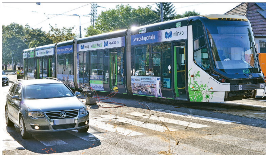
Nagy sebességgel hajtottak neki a villamosnak a hajnali órákban.

– Egy hosszú üzemórás, jelzőlámpás irányítású kereszteződés így kellőképp védettnek számít. A szombati baleset azonban a hajnali órákban történt, amikor a lámpa még csak sárgán villogva hívta fel a fi-