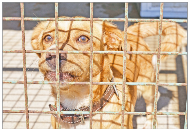
A telephely most is telt házzal üzemel.