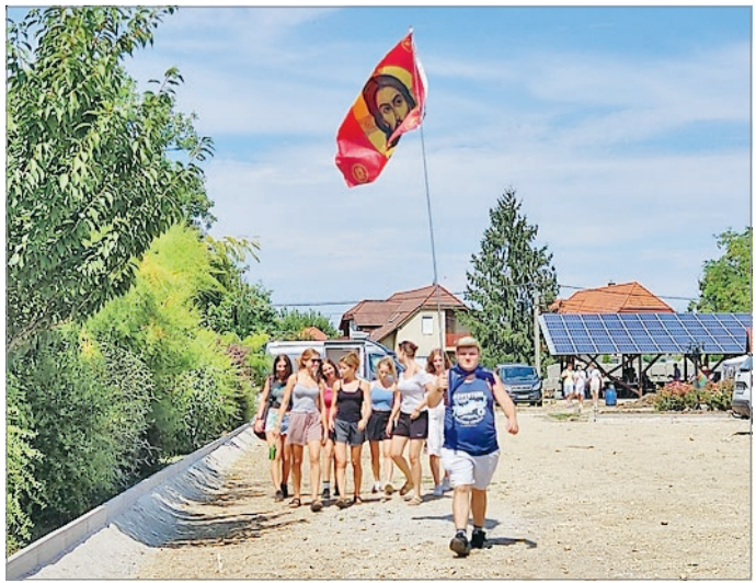
Mintegy háromszázan vágta neki a nagy útnak.

– Tőle hallottam erről először, láttam a fotókat, és néhány barátommal eldöntöttük, hogy mi is elindulunk. Sok dolgot megél belül az ember az út során. Van, aki azért jön, mert hálát akar adni, más a terheit szeretné letenni a Szűzanya elé. Együtt zarándokolunk, de közben mindenki a saját lelki útját járja. Azt gondolom, minél többet teszünk bele a részünkről, annál többet kapunk mi is vissza az Istentől – fogalmazott.