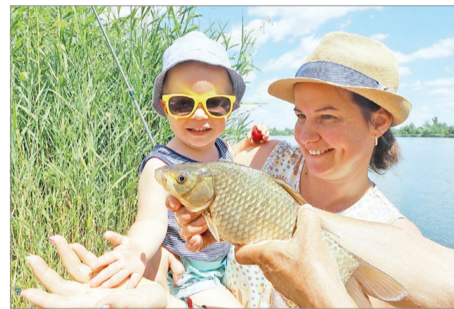
Könnyebben válthatunk jegyet, ha halat akarunk fogni

Kipróbáltuk: az alkalmazás könnyen átlátható, és több környékbeli tóra váltható rajta területi jegy. MN