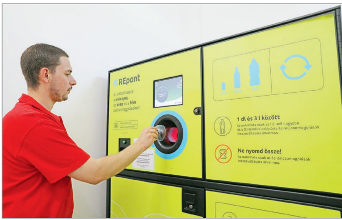
Százsámra visszük vissza a palackokat.