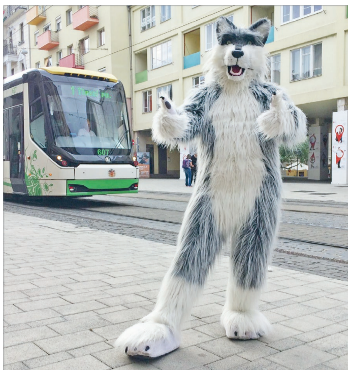
A hőség Loopyt sem kíméli, de ősszel visszatérhet

– Azt tudtam, hogy mindenképp állatfigurát szeretnék megformálni. Végig gondoltam, mi is jellemző rám, miből is választhatok: csökönyös tudok lenni, mint egy számár. Birkatürelmem van. Harapni is tudok, mint egy kutya, ha kell. De nem akarok