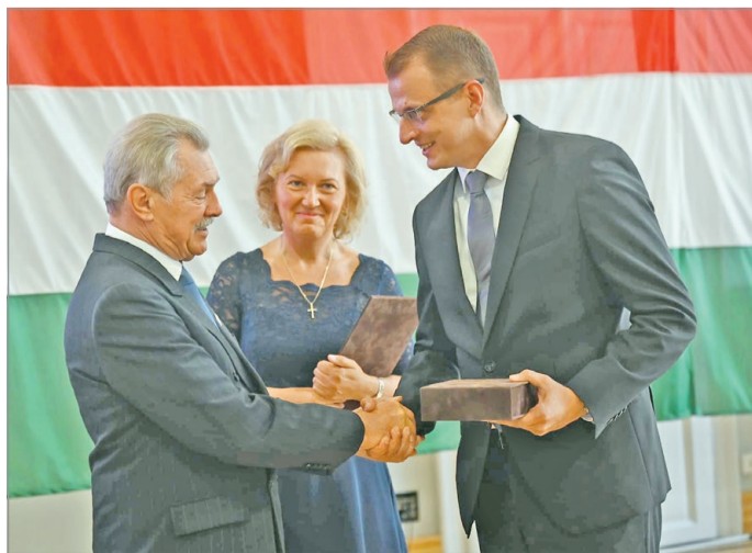
Farkas Bertalant díjazták idén.