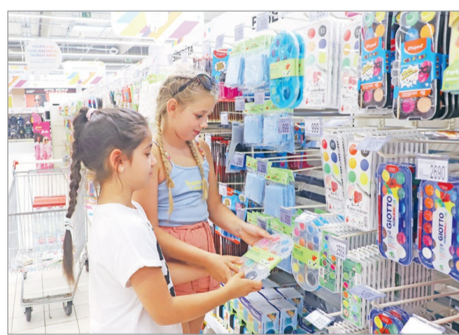
Szerencsére bő a választék mindenből.

A tolltartó paletta ennél jóval szélesebb, hiszen 1500 forinttól egészen 5 ezerig változhatunk. Ergonomikus iskolatáskát 10 ezer forintért is vehetünk, de egy ismert márkajelzéssel ellátott darab ugyanebben az áruházláncban akár 33 ezer forint is lehet. Szettet is kínálnak, ahol a táskához jár egy hozzáillő tolltartó és tornászak is, illetve 27 ezer forintért vásárolha-