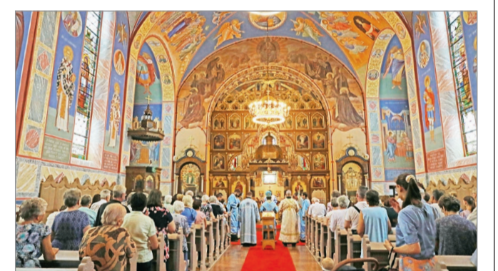
Kettős ünnepet tartottak.