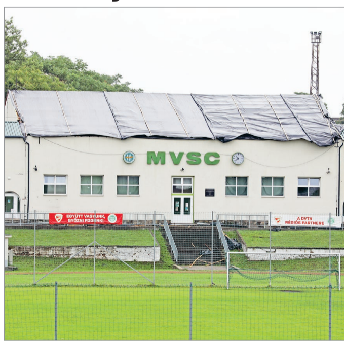
A június eleji szélsőséges időjárás nem kímélte az MVSC röplabdacsarnokát.

A Miskolc Televízió Sportpercek című műsorának múlt heti adásában Illyés Miklós