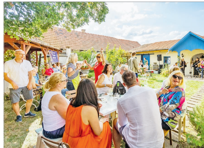
A fesztivál kiváló alkalom arra, hogy megkóstoljuk a vidék nedűit

A képzőművészet kedvelőinek érdemes lesz ellátogatni a Tokaj Art Wine Barka Galéria Hotel és Étterembe, ahol a fesztivál ide-