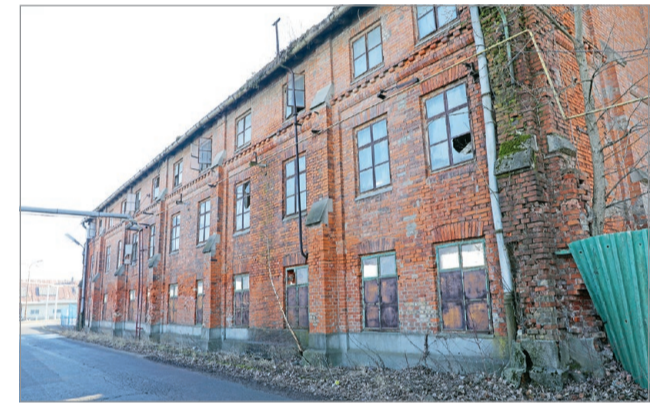
A miskolciak lelkében is sebet hagyott a DAM.