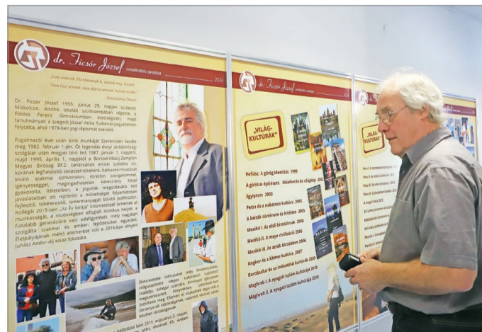
Személyes tárgyakkal, kiadott könyveivel és fotókkal emlékeznek címzetes táblabíróra.