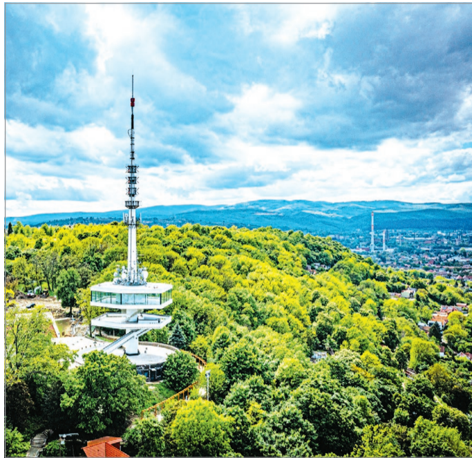
Miskolc ma új gazdasági időszak előtt áll.

– A második világháború éveit, a deportálásokat, a háború utáni időszak erőltetett iparosítása, az ehhez szükséges