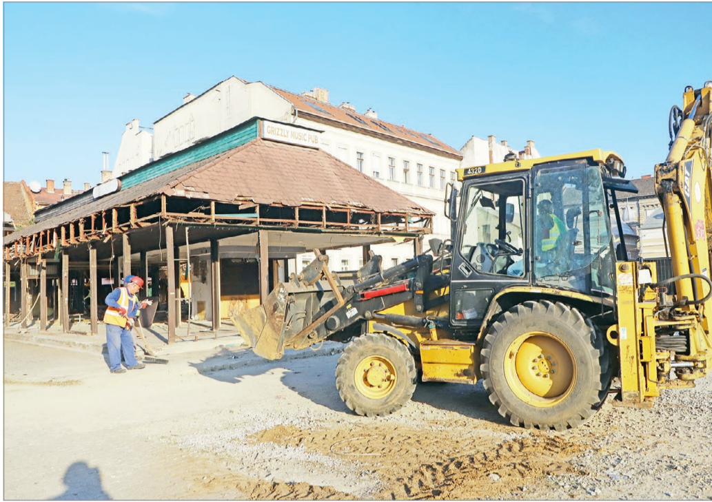
A kultikus vendéglátóhelyeknek otthont adó épületet a hét közepén kezdték bontani.

Tóth Róbert felidézte, olyan kilencven lakásos társasház komplexum épül, aminek aljában kiszolgáló egységek, kávézók, esetleg üzletek lesznek majd. „Az épületeket nagyvonalú térfelhasználási megoldásokkal úgy alakítottuk ki, hogy a jelenlegi kavicsos parkoló helyén létrehozunk egy passzázsot a Szent István és az Erzsébet tér között. Itt egy új közterület is létrejön, melyet a városlakók a nap huszonnégy órájában használhatnak. Emellett