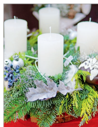
A protestáns egyházakban mind a négy gyertya egyszínű.

Elmondta, hogy az adventet már egészen korai századokban ünnepelték. Adventi koszorút pedig először Johann Hinrich Wichern német evangélikus lelkész, hamburgi árvaház-alapító készítette 1839-ben. Viszont