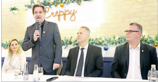
Miskolcra is megrendezték a Fiatal Vállalkozók Hetét.