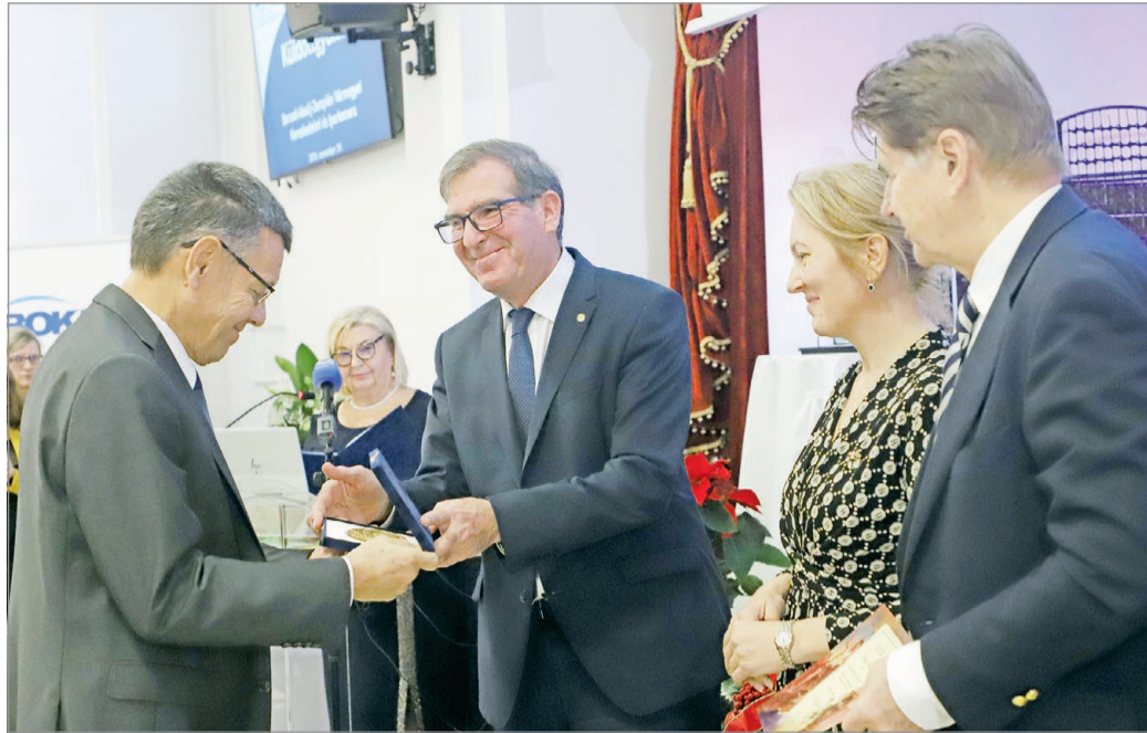
Elismeréseket is átadtak a BOKIK 69. küldöttgyűlésén.