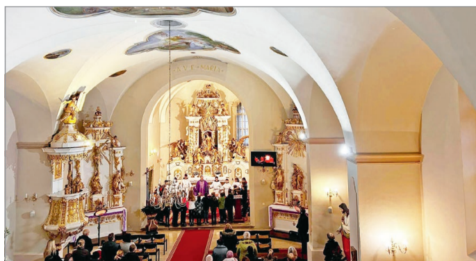
Advent diósgyőri plébánián.