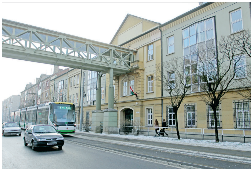
A 19. helyen végzett a Herman a HVG rangsorában.