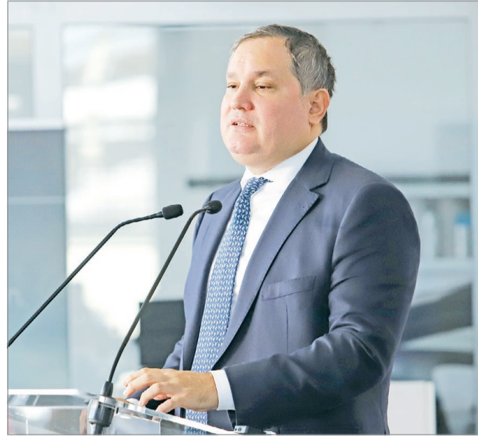
A nemzetgazdasági miniszter a Country Ride vendégeként érkezett a városba.

– Amikor átgondoltam a mai nap témáját, akkor dő-