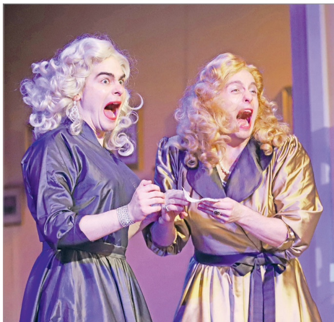
Különleges bohózzal zárja az évet a miskolci teátrum.

A Miskolci Nemzeti Színház November 29-én mutatta be a Primadonnák című bohózatot a Nagyszínházban. A darabot jegyző Ken Ludwigot szokás a legnépszerűbb kortárs amerikai szerzők között említeni. Nem véletlenül: pályája során színpadra alkalmazta a krimi királynőjének, Agatha Christie-nek a vonatos klasszikusát, emellett olyan sikerdarabokat is jegyez, mint a Botrány az operá-