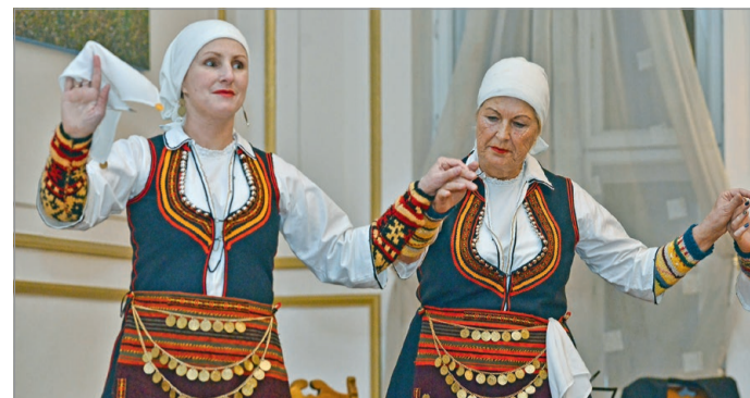
Az eseményen műsort adott az Ellinizmosz táncsoport is.

A görögség egyik legnagyobb nemzeti ünnepe alkalmából emlékeztek meg a miskolci városrosháza dísztermében szombat este.