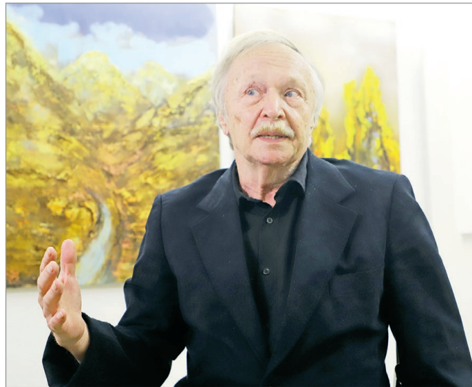
Demko László kedvencei a tájképek.

„Reálisból absztraktba” címmel nyílt meg a Feledy-házban, november 28-án,