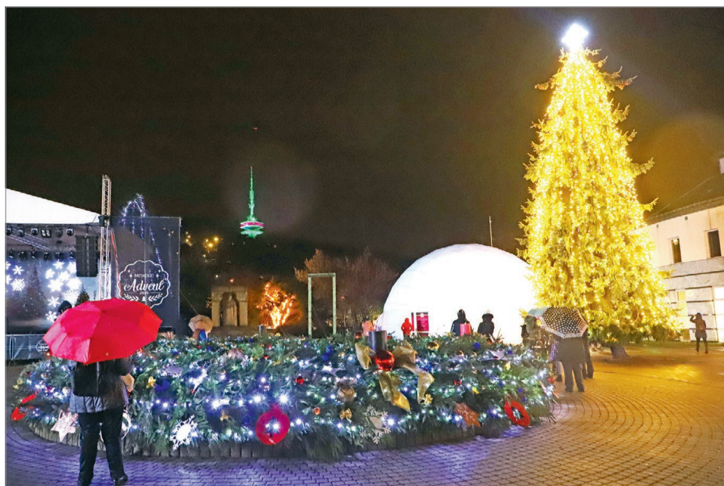
Nem csak a díszkivilágítást kapcsolták fel, ünnepi díszbe öltözött a kilátó is.

A városvezető újdonságként számolt be arról, hogy a már hagyományosan megszokott programsort az Avasi kilátónál tartott mintegy tízperces zenés fényjátékkal egészítik ki, amely a Szent István téren állva nyújtja majd a legnagyobb élvezetet. Míg a téren felállított hatalmas kupolasátorban egy 360 fokok,