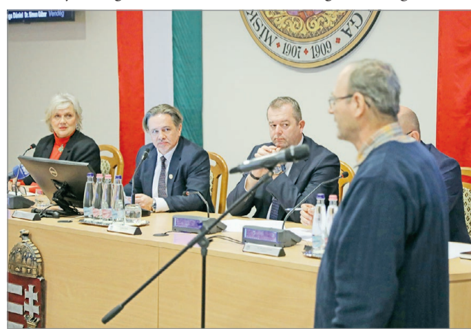
Az ideji közmeghallgatáson több mint huszan mondták el problémáikat a városvezetésnek.