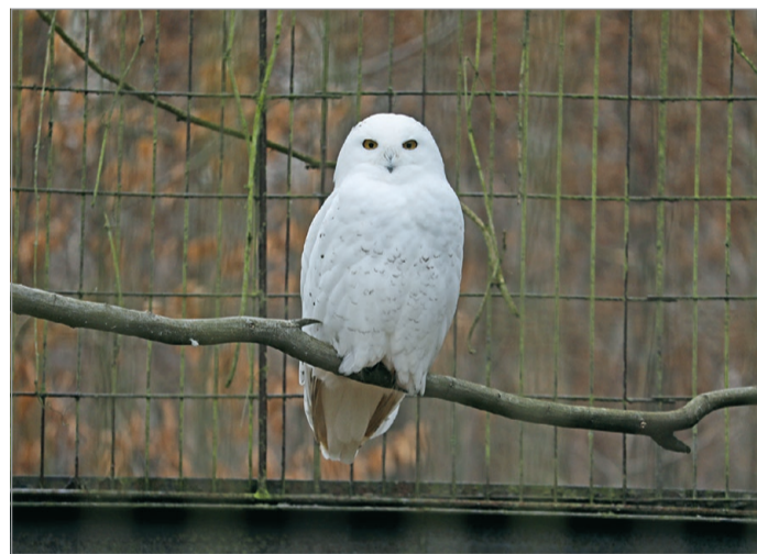
Égész évben várja a látogatókat az állatkert.

– Ilyenkor vastagabb alomréteget, szalmát adunk az áll-