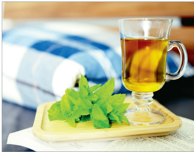
Vírusfertőzés idején az ágynyugalom, a folyadék és a vitamindús könnyű étrend a legfontosabb.

– Az influenzával szemben nemcsak vakcina segítségével, hanem spontán is kialakulhat időszakos védekezés, miután megfertőződünk. Általában három évig ugyanaz a vírus nem okoz megbetegedést újra, de más okozhat nagyon ha-