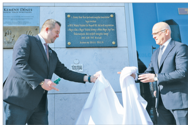
A fejlesztést hivatalosan pénteken adták át.