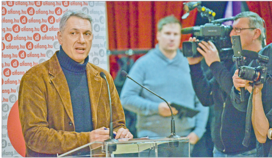
Lázár János azért érkezett Szikszóra, hogy válaszoljon a kérdésekre, és elnézést kérjen a kellemetlenségeikért.

– Éppen ezért bosszantó, ami történt. Egy olyan műszaki hibáról van szó, amiről kiderült a vizsgálatok során, hogy egyér-