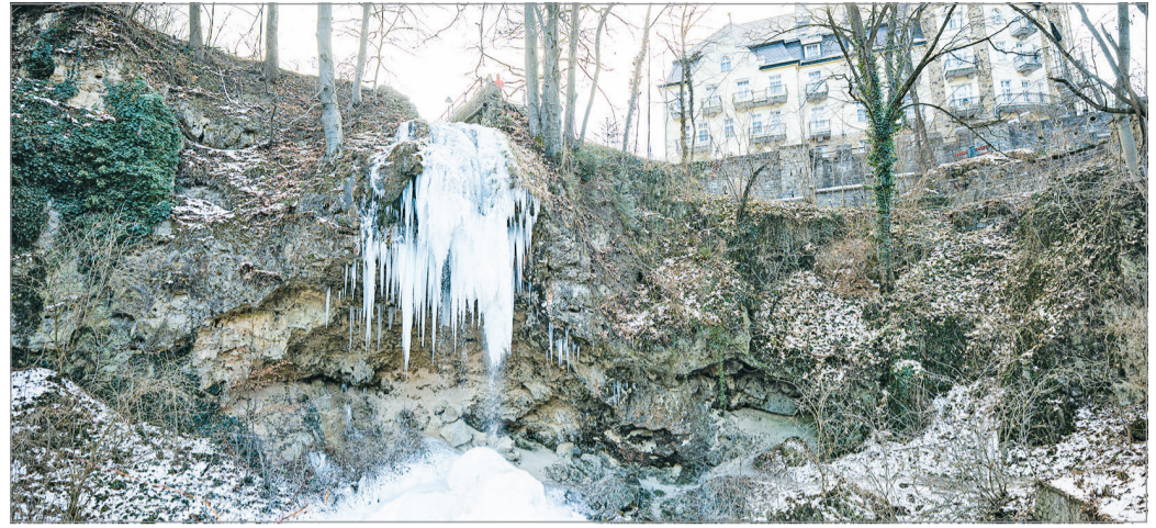
A kemény mínuszok miatt a vízesés is befagyott.

Így volt ez a Bükk-fennsíkon található töbrökben is. A Mohos-töbrökben működő mérőállomás kedd reggel