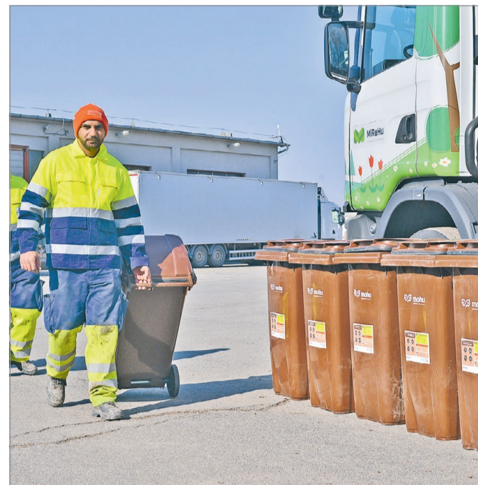
Bővítik a rendszert, így egyre többen gyűjthetik szelektíven a kommunális hulladékot.

Megtudtuk, a mostani bővítéssel nem zárul le ez a projekt sem, a MOHU tervezi a további lépéseket. Ahogyan eddig, úgy a háromszáz gyűjtőedényre kibővített mennyiségből is levonják majd a szükséges következtetéseket és tapasztalatokat. Jelenleg hente egyszer gyűjtik be ezt a fajta hulladékot, márciustól novemberig azonban hetente kétszer. Meglátják majd, hogy ez jelent-e mennyiségi növekedést is. A sűrűbb begyűjtés