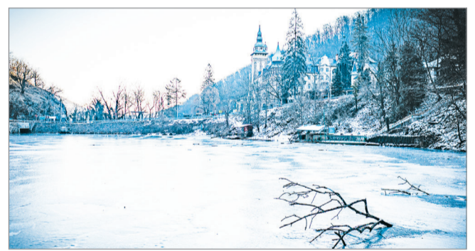
Bár sokaknak hívogató, de tilos és balesetveszélyes a Hámori-tó jegére lépni.

– Kizárólag olyan helyen merészkedjünk a jégre, ahol a vízfelület kezelője ellenőrizzte annak vastagságát és engedélyezte a jégen tartózkodást! Ezek lehetnek önkormányzatok, egyesületek, horgász társaságok, amelyeknek a platformjait érdemes figyelni, ahol közlések ezek az infor-