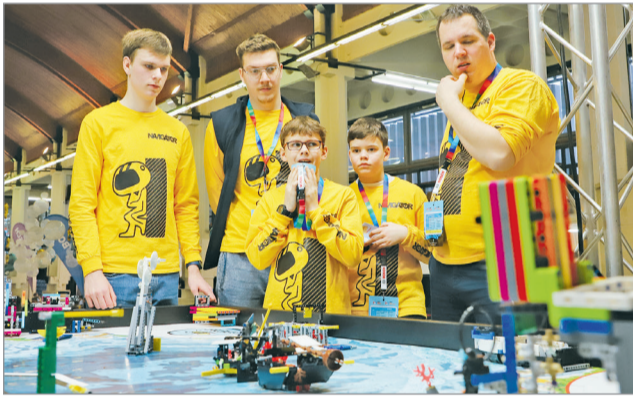
A diákok különféle robotokat építettek.