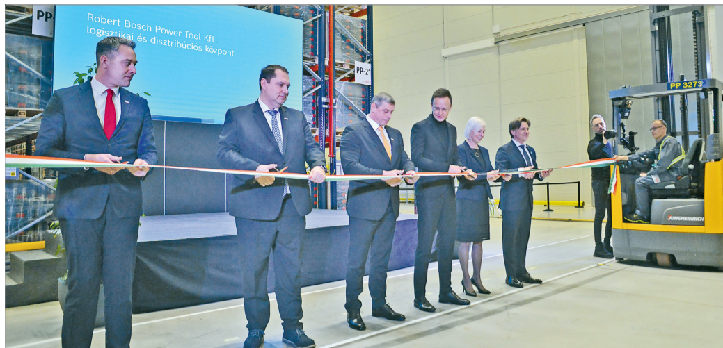
Az 54 milliárd forintból megépült csarnokot még 2021-ben kezdték építeni.

A nagyszabású beruházással egy olyan korszerű raktári struktúrát alakítottak ki a Miskolci Ipari Park (korábbi repülőtér) területén, amelyben számos Ipar4.0 megoldást is alkalmaztak. A rendszer a