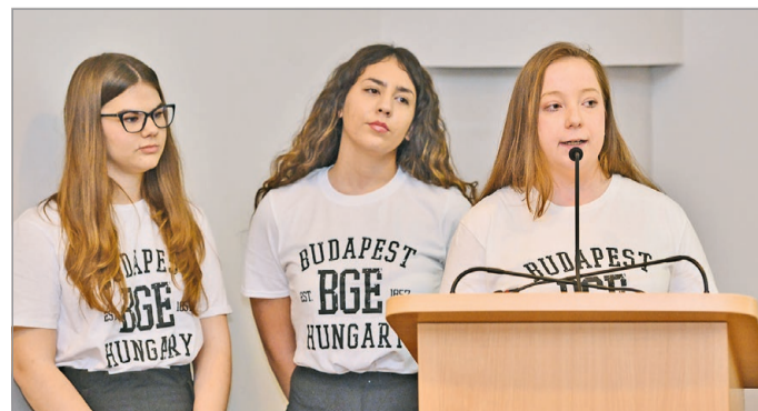
A megmérettetésen tizenhárom csapat mérte össze tudását.