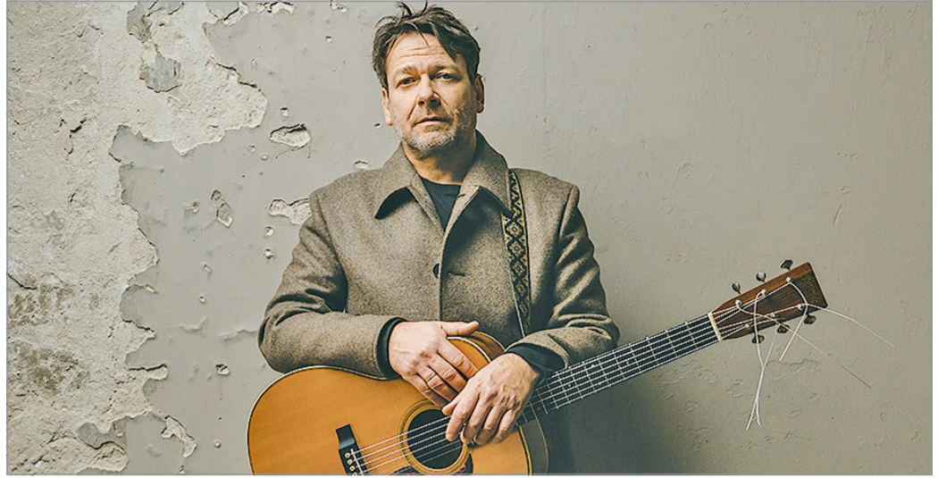
Több mint három évtized dalaiból válogat Lovasi András

A különböző zenekari formációkban működő előadó most a 38 év dalaiból összeállt életműből merít az „egyszálgitáros” műsorában. Március 27-én, csütörtökön az Ady Endre Művelődési Házban előkerül-