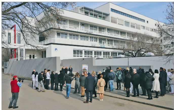
A jövőre ötven éves épületre ráfért már a felújítás.