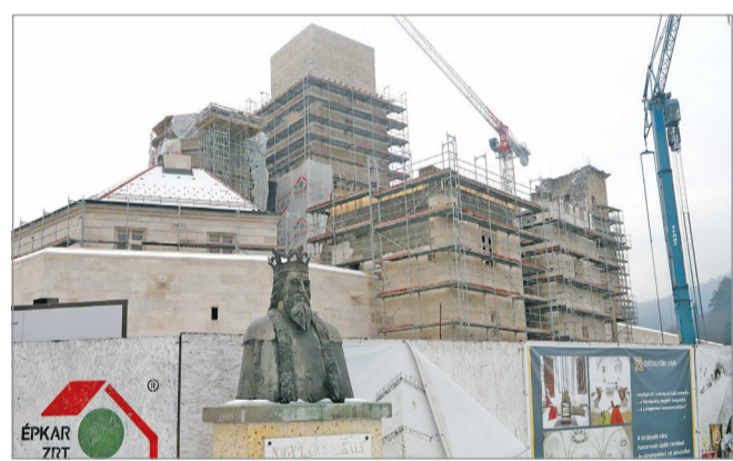
Januári helyzetkép a diósgyőri várról.

Külső teraszok létrehozása is szerepel a projektben. Itt képzelik el a királyné kertjét, ahol középkori gyógynövényekre és azokból készült korabeli receptekre bukkanhatnak majd a lá-