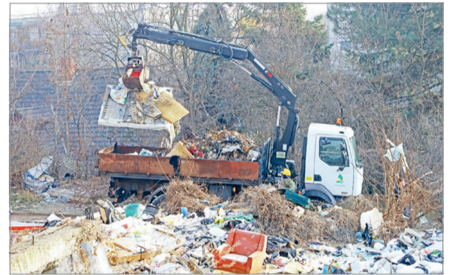
A területéről több tonna szemetet szállítottak el.