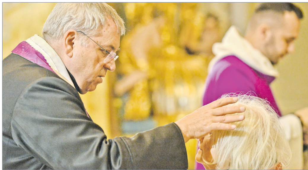
Hamvazással kezdődött a nagyböjt a Mindszenti templomban.

– Az önfegyelmzés és a bűneink feletti vezeklés egyik legjobb eszköze a böjt, amikor egy számunkra kellemes dolgot megvonunk magunktól. Ez hagyományosan a hús, de lehet bármi, ami a szenved-