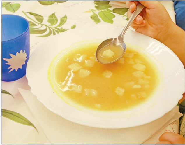
A gyerekek is értékelhetnek.