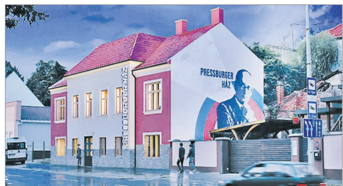
Így nézhet majd ki – célegyenesben a Pressburger-ház felújítása

Mint megtudtuk, a konkrét kivitelezés idén augusztus-szeptember környékén kezdődhet a Szentpéteri kapu 3. szám alatti épületen. A nagyjából négy-öt hónaposra becsült munka végétével jövő ilyenkor nyithat meg a komplexum. MN