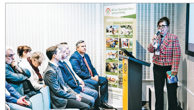
Hatalmas a várakozás a helyi turisztikai szereplők körében.

Miután a stratégiát a turisztikai szolgáltatókkal közösen tudják csak megvalósítani, ezért első pillanattól bevonják őket és számítanak rájuk – ez indokolta legfőképp a fórum életre hívását. A szervezők előzetesen meghirdetett célja az volt ugyanis, hogy erősítsék a párbeszédet a turisztikai szereplők és az önkormányzat között egy olyan együttműkö-