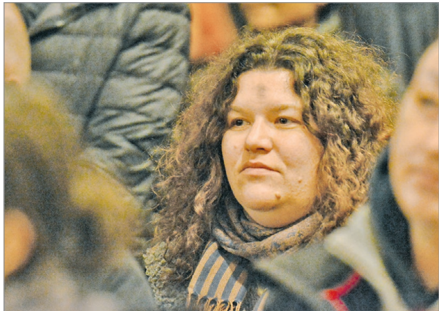
A hamukereszt az esendőség jele.