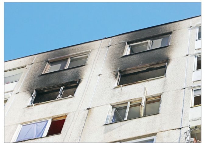
Hétfő hajnalban csaptak fel a lángok Diósgyőrben.

A híreket követően, már a hétfő reggeli órákban a hely-