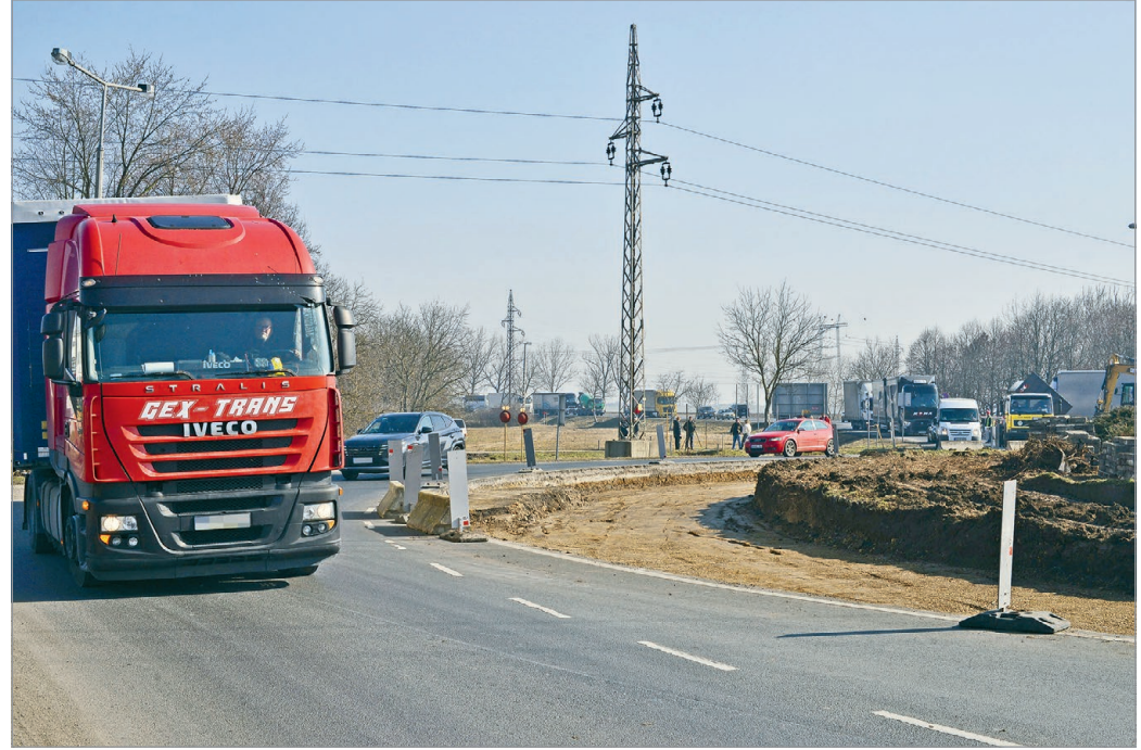
Elkezdtek átépíteni az arnóti körforgalmat, ami plusz egy sávval bővül.

– Felvettem a kapcsolatot a Magyar Közúttal és a minisztériummal, arról faggattam a szakembereket, mit lehet ten-