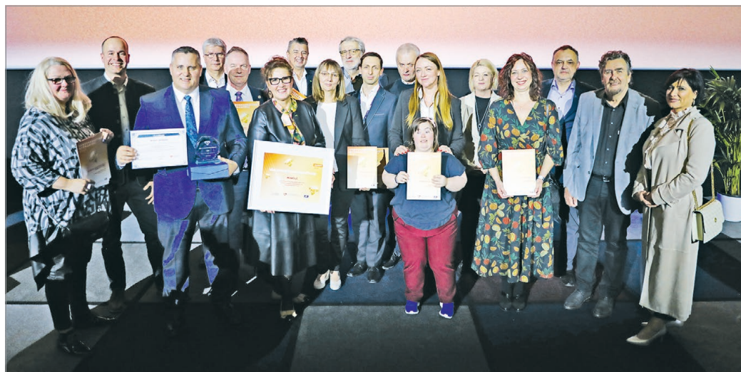
Idén 21 Városmarketing Díjat nyert el Miskolc, ezzel kiérdemelte a Városmarketing Nagykövete címet

Miskolc sikeres projektjeinek összefogását, a pályázatok határidőre történő benyújtását a MIDMAR desztináció menedzsmentért felelős szervezet új ügyvezető igazgatója koordinálta. A díjátadó után