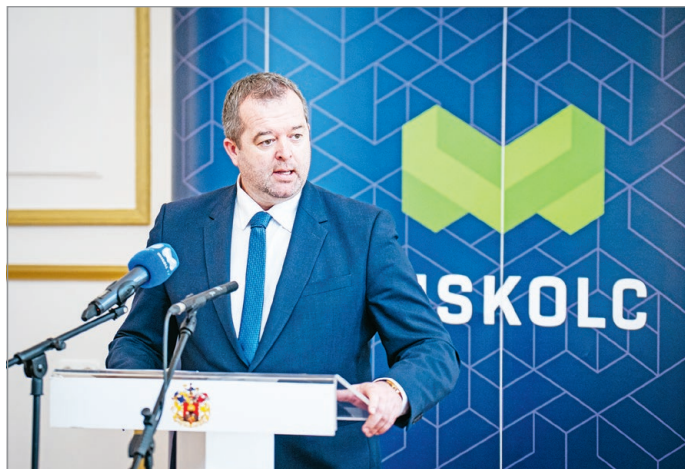
Az önkormányzat nyitott volt a kezdeményezésre.