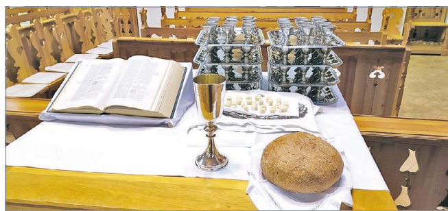
A Deszkatemplomban úrvacsora ad nyomatékot a böjtnek