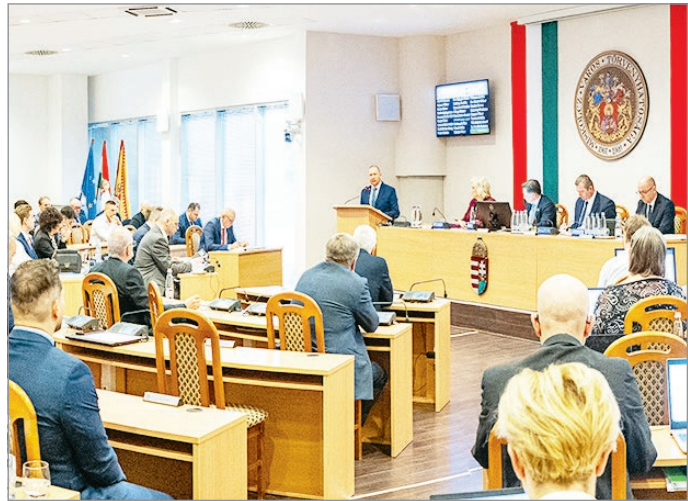
Huszonhárom napirendi pontról szavaztak