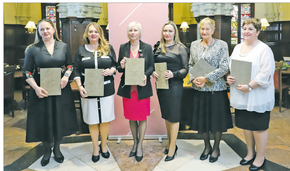
A hagyományos családmódellet fontosságát hangsúlyozzák.